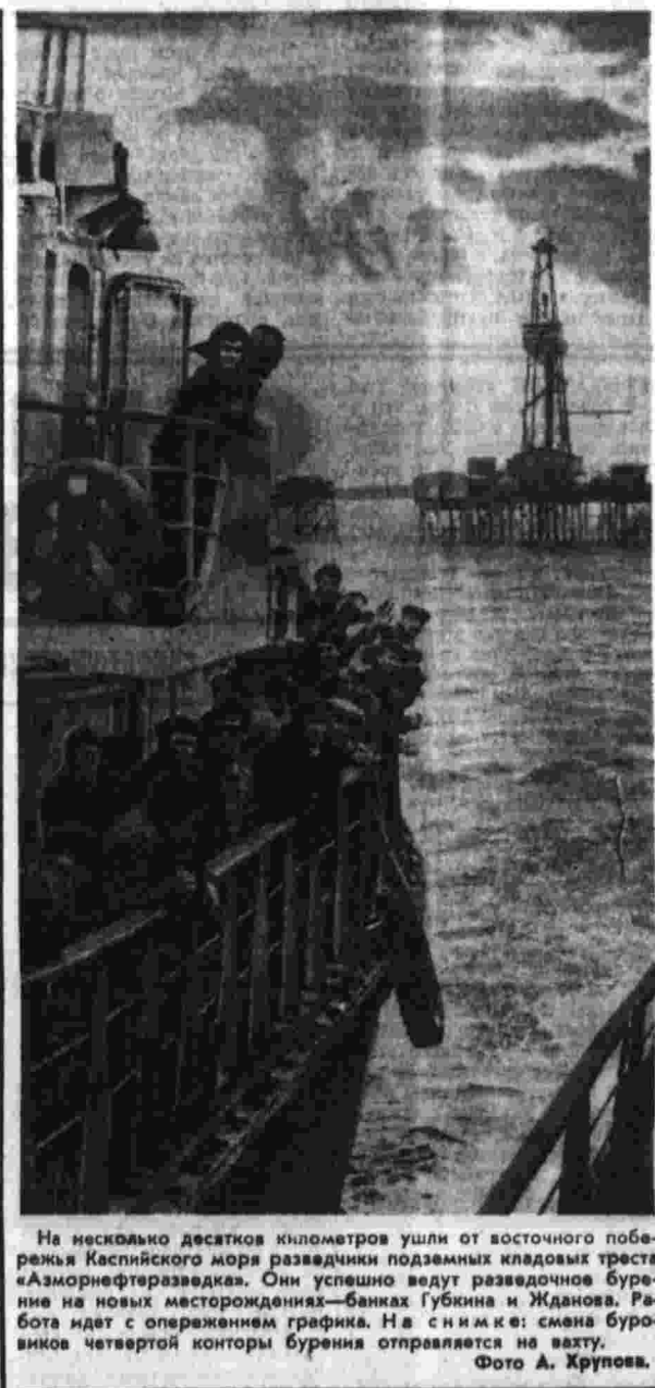
На нескольких десятках километров...