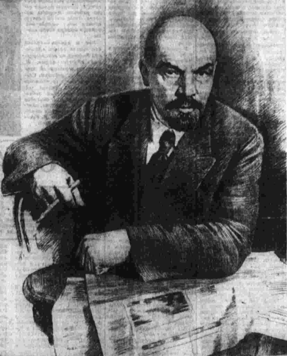
В. И. Ленин в «Правде».

▲ С 5 мая 1970 по 5 мая 1971 года 18 газет были награждены орденом Советского Союза, а том числе «Сельская жизнь», «Труд» и «Литературная газета» — орденом Ленина.