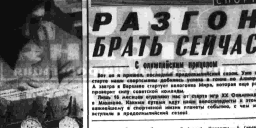
Вот он и пришел, последний преддольный сезон. Уже на старте наши спортсмены добились успеха в гонке по лыжам.