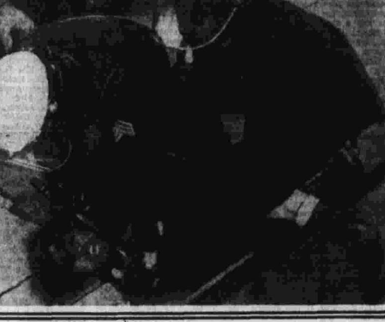
«Результаты настойчивой работы»

ХЕЛЬСИНКИ, 4 (ТАСС). Официальный визит премьер-министра Финляндии Ахти Карьялайнена в Советский Союз был успешным, констатируется в резолюции, которая была принята на заседании совета уполномоченных партий центра Финляндии. Как отмечается в резолюции, подписанной во время визита протоколы и Договор о развитии экономического, технического и промышленного сотрудничества подписаны, что создает дополнительные возможности для расширения сотрудничества между партиями центра Финляндии. Как отмечается в резолюции, подписанной во время визита протоколы и Договор о развитии экономического, технического и промышленного сотрудничества подписаны, что создает дополнительные возможности для расширения сотрудничества между партиями центра Финляндии.