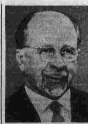
Председатель СЕПГ товарищ В. Ульбрихт