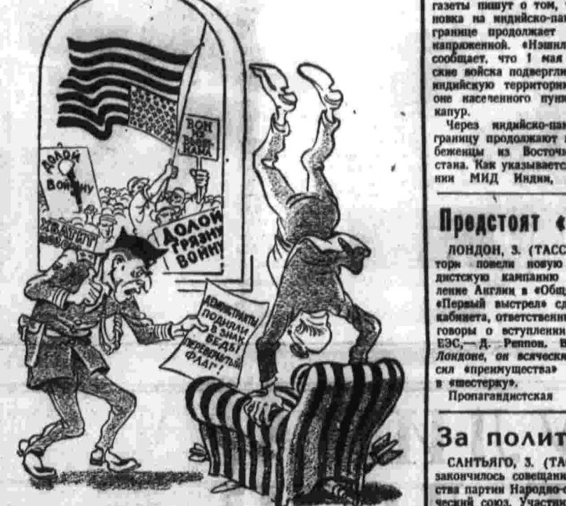
— Господи министр, беда... Взор! Николай беда нет — надо правильно смотреть на вещи... Рис. В. Фомичева.

САНТЬЯГО, 3. (ТАСС). Здесь закончилось совещание руководителей партии Народного социалистического союза. Уставшим совещание приняло резолюцию, в которой отмечается важность проведения в Чили политических, экономических и социальных пре-