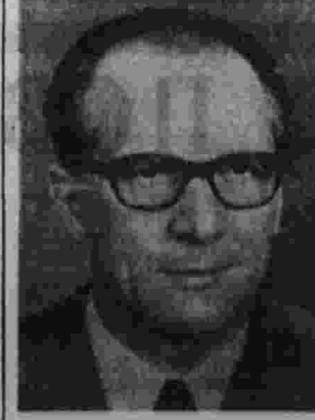
Первый секретарь ЦК СЕПГ товарищ Э. Хонеккер