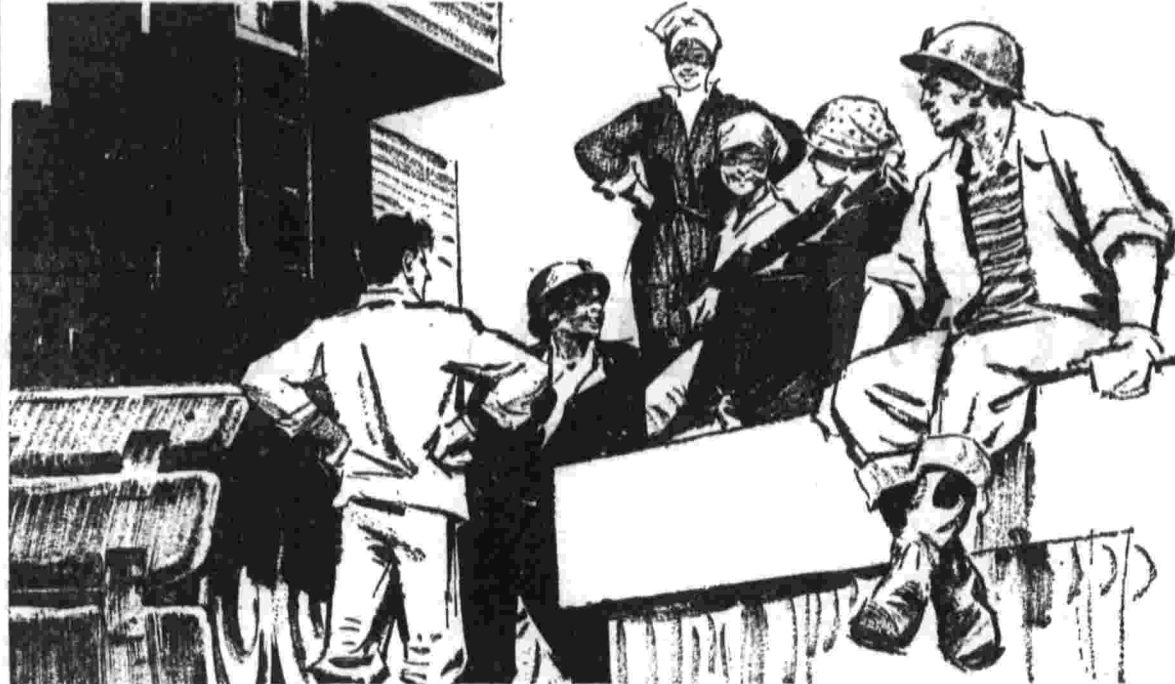
В ущелье Чарыка, на отрогах Западного Тянь-Шаня, сооружается семнадцатая гидроэлектростанция Чирчикского каскада.

Степень изученности недр нашей страны еще не велика, — рассказывает начальник управления научно-исследовательских организаций Министрства геологии СССР доктор геолого-минералогических наук Г. И. Горбунов.