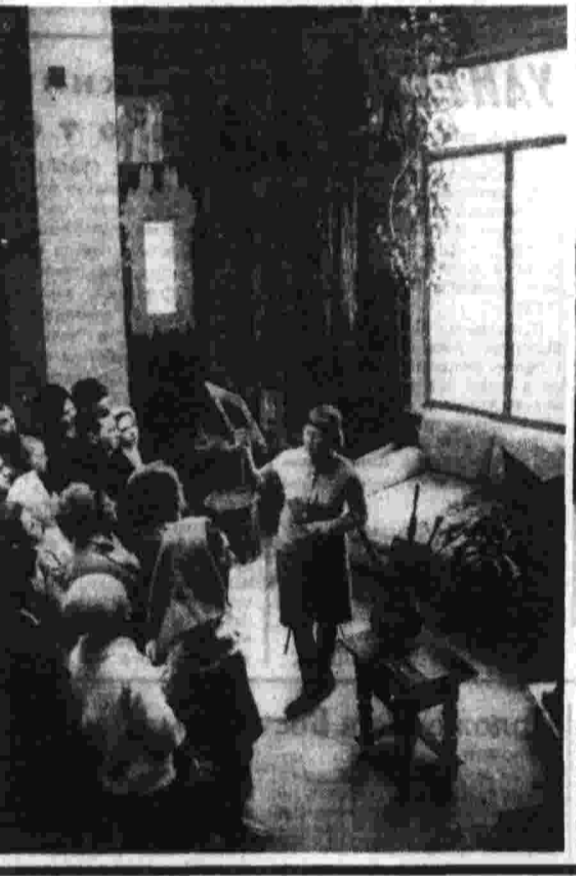
В село Найхин приехали гости — корреспонденты газет, радио, телевидения из нескольких зарубежных стран.

КИШИНЕВ, 28. (Корр. «Правды» П. Богатенков). Ученики кишиневской средней школы № 41 в торжественной обстановке передали представителям колхоза «Друмил» ленинскую тракторную технику только что обобщенной с конвейера трактор. Он изготовлен в невручную время колхозницами и молодежью Кишиневского тракторного завода из металлолома. Соборного учащимся школы № 41.