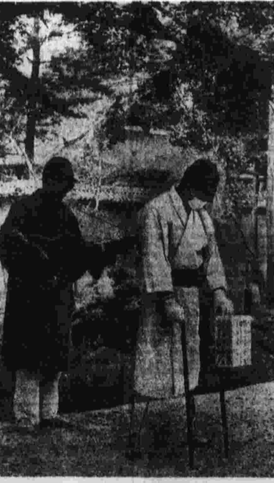
Делегация итальянских коммунистов-парламентариев во главе с членом ЦК ИКП Дж. Фабби. (ТАСС).

По приглашению ЦК КПСС с 14 по 28 апреля в Советском Союзе находилась делегация итальянских коммунистов-парламентариев во главе с членом ЦК ИКП Дж. Фабби. Кроме Москвы, делегация посетила Киев, Ленинград, Вержасы. Итальянские товарищи имели беседы в Международном отделе ЦК КПСС, в Верховном Совете СССР, в Верховных Советах РСФСР и Украины; встречались с депутатами областных, городских, районных и сельских Советов, посетили промышленные предприятия и колхозы. (ТАСС).