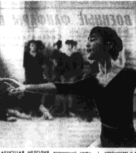
Чарующая мелодия, волнующий танец, картина, написанная удивительно кистью художника, открывает нам мир прекрасного...