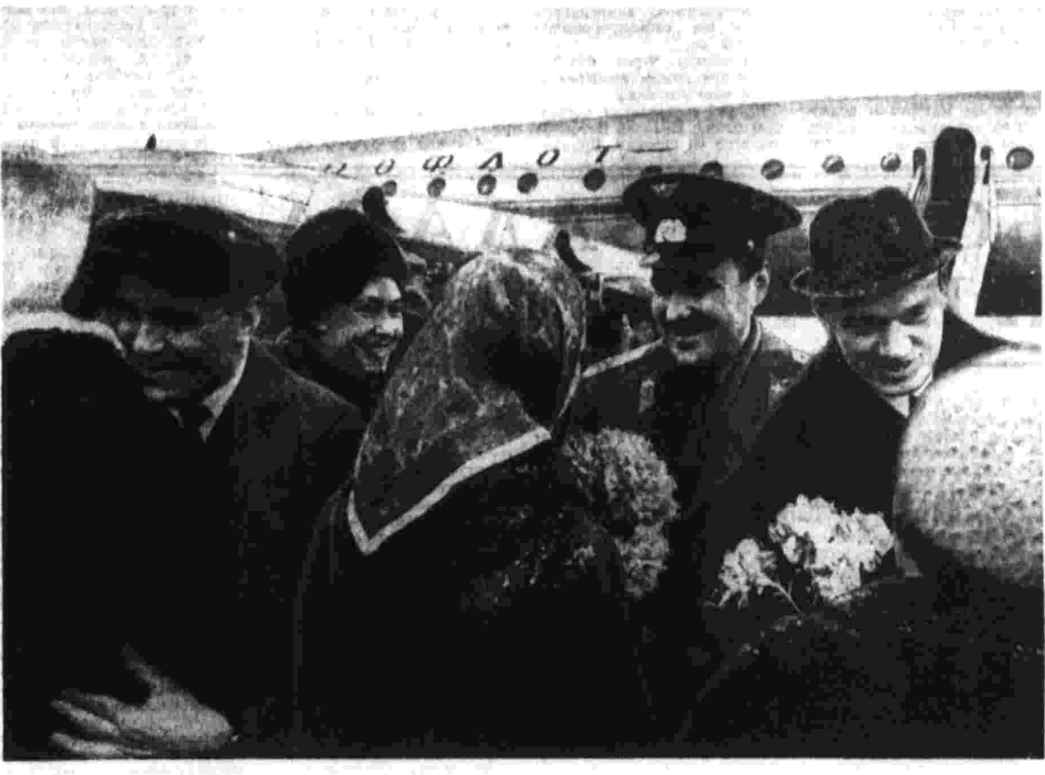
Сердечная встреча героев космоса в Москве.

Ни густой смог, ни резкий порывистый ветер не смогли охладить этой сердечной, радостной встречи. Каждый житель звездного ждал ее с огромным нетерпением. Всюду флаги, транспаранты, лозунги. У клуба космонавтов горячими аплодисментами встретили жителей славной земли космического корабля «Союз-10». Герои космоса прибыли на эту встречу с подмосковного аэродрома. Несмотря на непогоду, летчики совершили виртуозную посад-