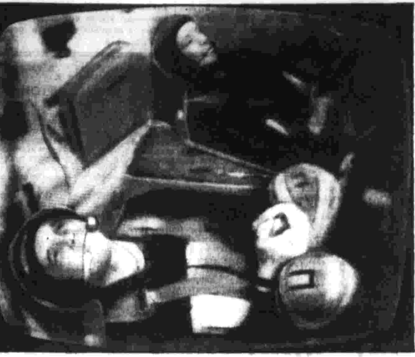
Полет проходит успешно