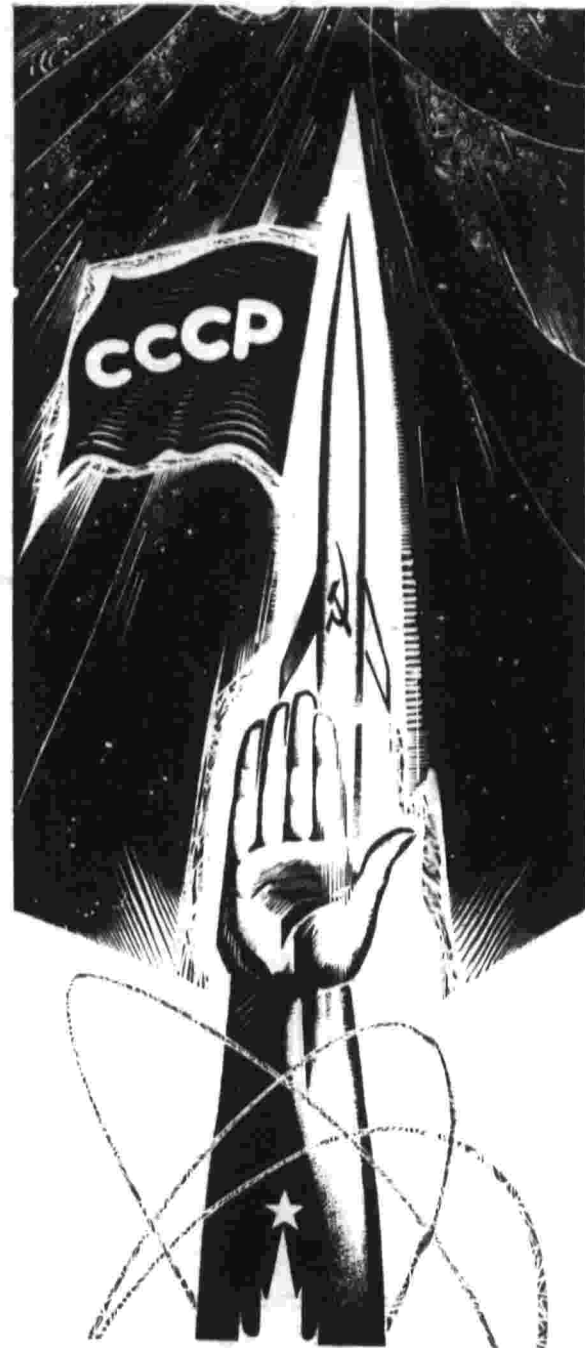
Рисунок В. Лукьянца.

Слава советским ученым, конструкторам, инженерам, техникам и рабочим, открывающим новые горизонты в освоении космического пространства! Слава доблестным советским космонавтам! (Из Призывов ЦК КПСС.)