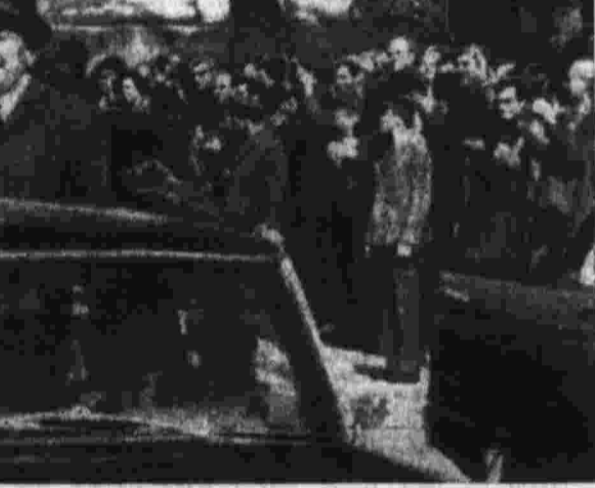
19 апреля в столицу Народной Республики Болгарии на X съезд БКП прибыла делегация Коммунистической партии Советского Союза во главе с Генеральным секретарем ЦК КПСС товарищем Л. И. Брежневым. На снимке: жители Софии приветствуют товарища Л. И. Брежнева и Первого секретаря ЦК БКП товарища Тодора Живкова на площади 9 Септември.

На 18 часов московского времени станция совершила девять оборотов вокруг Земли. По данным телеметрической информации, бортовые системы и научная аппаратура функционируют нормально. Следение за полетом и управление станцией производится с помощью измерительных пунктов, расположенных на территории Советского Союза и кораблях Академии наук СССР «Морской», «Герост» и «Академик Сергей Королев», находящихся в акватории Атлантического океана.