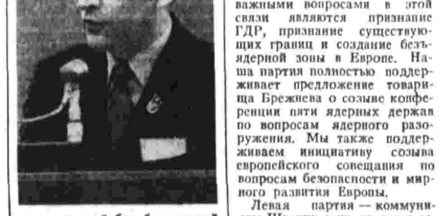
правительства Южного Вьетнама. Расширение американскими империалистами войны в Индокитае вызвало дальнейшую активизацию движения солидарности. В первых рядах в этой борьбе в нашей стране идут коммунисты. (Аплодисменты). Общественная жизнь нашей страны все более определяется выступлениями против присоединения Швеции к «Общему рынку». Все большее число людей, а также групп и партий понимают, что «Общий рынок» — это политический союз, подчиненный целям и интересам НАТО. Под давлением общественного мнения шведское правительство заявило, что оно не присоединится к «Общему рынку», которая ограничивает право самоопределения нашей страны в политических, экономических и социальных вопросах. Швеция не обходимо равняться торговые связи со всеми странами, в том числе с социалистическими государствами. Осуществление 9-го пятилетнего плана, намеченного в докладе товарища Брежнева, дает основу для дальнейшего развития торговли между СССР и Швецией. Это явилось бы существенным вкладом в мирное развитие Европы. Мы считаем, что другим важным вопросом в этой связи является признание ГДР, признание существующих прав и создание беззастенчивой зоны в Европе. Наша партия полностью поддерживает предложение товарища Брежнева о созыве конференции пяти ядерных держав по вопросам ядерного разоружения. Мы также поддерживаем инициативу созыва европейского совещания по вопросам безопасности и мирного развития Европы. Левая партия — коммунисты Швеции считает, что в совместной борьбе за мир и социализм коммунистические и рабочие партии должны сотрудничать на основе принципов пролетарского интернационализма, самостоятельности и равноправия всех братских партий, на основе уважения суверенитета и права всех наций на самоопределение. Да здравствует пролетарский интернационализм! (Аплодисменты). Да здравствует борьба за свободу народов Индокитае и других угнетенных и поддерживающих агрессивных народов! (Аплодисменты). Да здравствует борьба за свободу народов Индокитае и других угнетенных и поддерживающих агрессивных народов! (Аплодисменты).

происходит также ухудшение окружающей среды. Хищнически эксплуатация природных ресурсов, капиталы не обращают никакого внимания на то, что отравляют воздух, землю и воду. Рабочие на такое ухудшение условий жизни отвечают забастовками. Самой крупной из них была забастовка шахтеров на рудниках Северной Швеции в прошлом году. Созданная забастовками обстановка складывалась в результате выборов в шведский риксдаг в сентябре 1970 года. Реакция наделала вытеснить коммунистов из парламентской власти. Наша партия, возглавляющая борьбу трудящихся, сумела, однако, собрать больше, чем ранее, число голосов избирателей и получить в риксдаге 17 мандатов вместо 4. Это предотвратило создание правительства буржуазных партий, так как мы компенсировали потерю голосов социал-демократами. Результаты этих выборов имеют большое значение не только с точки зрения внутренней политики. Они означают также, что вклад Швеции в дело солидарности с народами угнетенными империализмом, и в первую очередь с народами Индокитае, может быть увеличен. Движение солидарности с народами Индокитае в Швеции охватывает все слои населения. Это привело к тому, что правительство Швеции признало Демократическую Республику Вьетнам, а американские военнослужащие, отказавшиеся воевать во Вьетнаме, получили разрешение на пребывание в Швеции. Сейчас очень важно усилить требования за признание Швецией также и Временного революционного