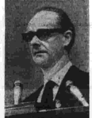
Джон Голлан, генеральный секретарь Коммунистической партии Великобритании.

В мировом коммунистическом движении могут существовать и существуют различные точки зрения по некоторым вопросам. Позицию нашей партии мы изложили на