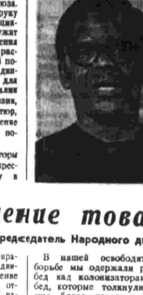
Южная Африка. Вместе с тем высший боевой дух народа приводит фашистов к отчаянию.

Расисты и эксплуататоры обрушивают жестокие репрессии на борцов за свободу в