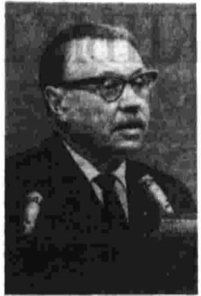
Товарищ А. Ю. Снечук

Уважаемые товарищи! В Отчетном докладе Центрального Комитета Коммунистической партии Советского Союза, сделанном Леонидом Ильичем Брежневым, дан глубоко научный анализ титанической деятельности нашей партии и государства по выполнению решений XXIII съезда КПСС, четко определен курс дальнейшего общественного и экономического развития страны. В докладе убедительно показана жизненность генеральной линии партии и последовательная борьба ленинского Центрального Комитета КПСС, Политбюро ЦК за ее неуклонное осуществление.