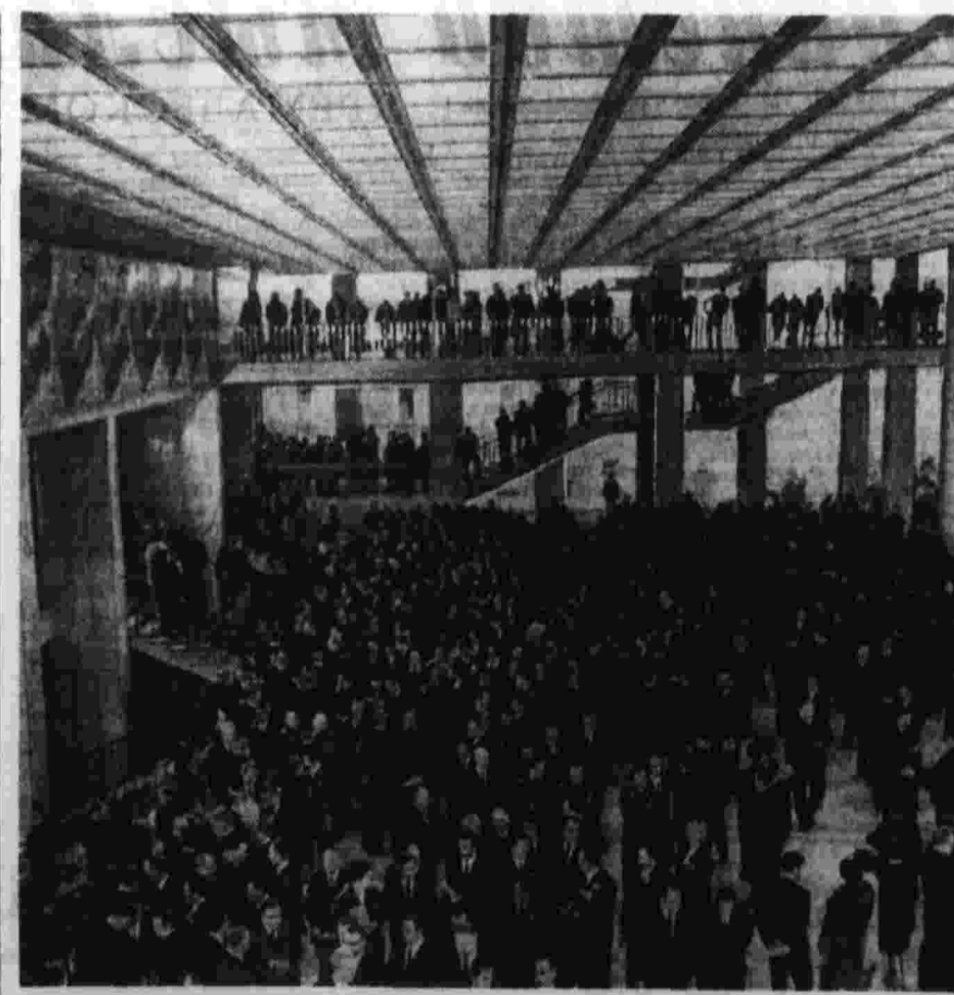
В фойе Кремлевского Дворца съездов во время перерыва между заседаниями.

Коммунисты, все труженики нашей республики высоко оценивают неуклонную деятельность Центрального Комитета нашей партии в борьбе за сплоченность социалистических стран, мирового коммунистического движения.