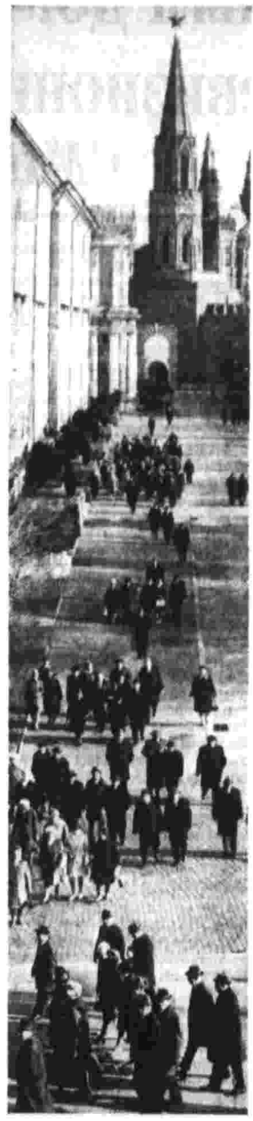
Москва, Кремль. 2 апреля 1971 года. На снимке: сверху — делегаты направляются к Кремлевскому Дворцу съездов; внизу — в зале заседаний.

Затем съезд приветствовал горячо встреченных делегатами и гостями представителями зарубежных коммунистических партий: товарищ Луис КОРВАЛАН — Генеральный секретарь Коммунистической партии Чили, Гэс ХОЛЛ — Генеральный секретарь Коммунистической партии США, Чандра Раджешвар РАО — Генеральный секретарь Национального совета Коммунистической партии Индии.