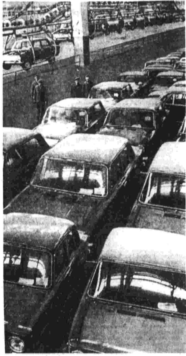
На снимке: главный конвейер Волжского автомобильного завода.

Вашим героическим трудом в короткий срок и на высоком техническом уровне выполнен огромный объем строительных и монтажных работ. Это результат самоотверженного труда строителей и монтажников, неустанной заботы Центрального Комитета Коммунистической партии Советского Союза и Советского правительства.