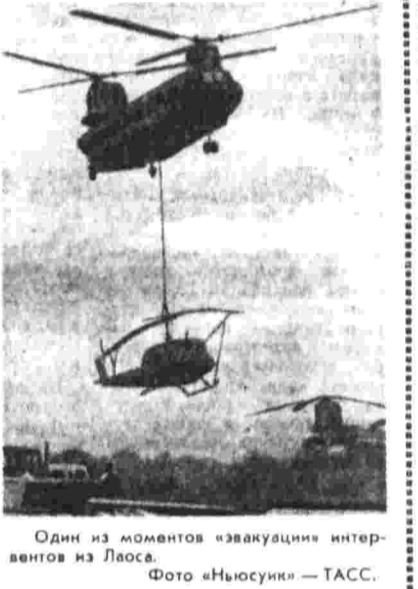
Один из моментов «эвакуации» интервентов из Лаоса.

Вашингтон, 27. (ТАСС). Государственный секретарь У. Роджерс представил конгрессу доклад об американской внешней политике. Этот пространственный документ ставит своей целью оправдание международного курса республиканского правительства, высказывающего, по признанию самого Роджерса, «разногласия» и «глубокую разобщенность» в американском обществе.