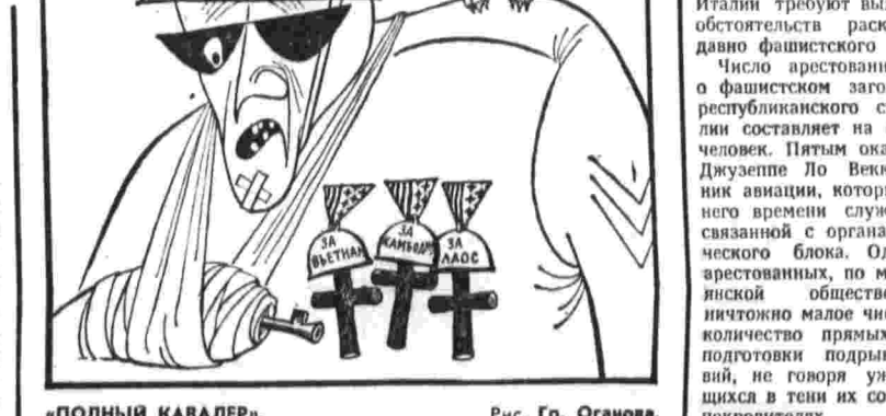
«ПОЛНЫЙ КАВАЛЕР». Рис. Гр. Оганова.

указывают, например, что именно в дни планирования американо-итальянской операции «Уинта» выступили с серьезными предупреждениями о вынашивавшихся крайне правыми силами преступных замыслах.