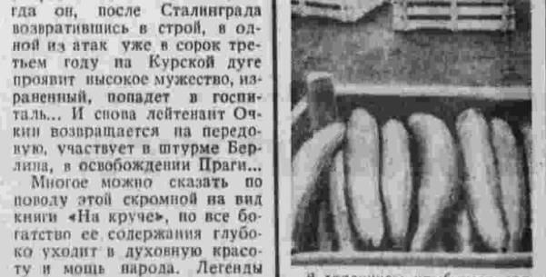
В тепличном комбинате совхоза «Московский» (Московская область) ежедневно собирают уроды огурцов, помидоров, редиса.