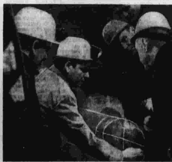
Криворозье — одно из самых старых и богатейших рудных месторождений. Каждая вторая тонна металла в нашей стране выплачивается из криворозьской руды. Из года в год совершенствуются здесь технологии добычи руды и доставки ее из шахты на поверхность.

хозов имени Карла Маркса, «Полярная звезда», имени Зигельса и других хозяйства Среднечирчикского района Ташкентской области также закончили сев колосовых. Предельное соревнование на селе вывало высокую трудовую активность земледельцев. По ударному работают механизаторы юга Украины. В хозяйствах Измаильского района Одесской области они трудятся круглые сутки: почку боронуют зыб и культивируют почву, днем сеют. Такая организация труда позволила хлеборобам района в короткие сроки провести боронование почвы на площади, превышающей 50 тысяч гектаров. Дождливая погода несколько затягивает начало посевной на Дону. Но в южных районах механизаторы уже вышли в поле. Они ведут подготовку почвы под яровые культуры. Первые тысячи гектаров бороновали трактористы Егорлыкского района. В новой вятлетке большие задачи поставлены перед хлопководными бригадами восточных районов. Проступили к севу яровых культур хозяйства Крыма, Кубани и Ставрополья, Северной Осетии и Молдавии. Начали посадку картофеля и овощных культур и совхозы Грузии и Киргизии... По старой хорошей традиции, проводящая хлеборобы в поле, хочется сказать: «В добрый путь, земледельцы! Хорошего тебе настроения, успешной работы на селе и богатого урожая на хлебной ниве!»