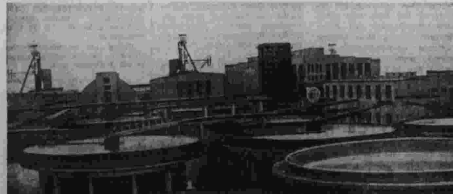
Общий вид Второго солгорского калийного комбината.

«Правда» продолжает цикл сообщений о деятельности центральных комитетов в сфере сотрудничества рабочих со средствами и труженников села. Будет передана по партийной программе сегодня, в 16 часов 40 минут.