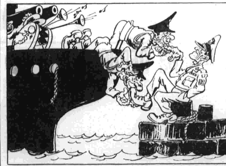
Политическая позиция хунты. Рис. А. Баженова.

Сейчас существует 100 основных военных подрядчиков Пентагона, среди которых размещается 70 процентов всех военных заказов. 20 из них — гигантские «фабрики смерти», работающие в области стратегического оружия. Тесно переплетаются они с Пентагоном, создавая свое «государство в государстве». В настоящее время, как утверждает в последнем номере журнала «Нешнл», Пентагон связан с монополиями военно-промышленного комплекса 20 тысячами контрактов.