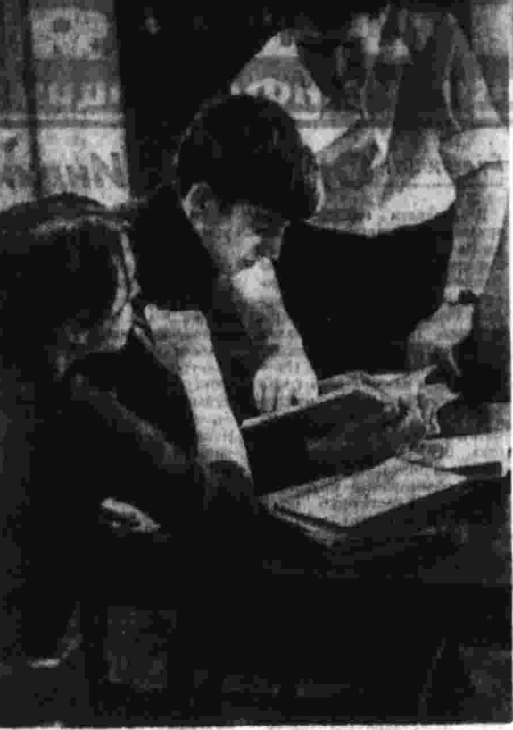
Когда мы отдыхаем

которого моделировал определенную область лунной поверхности. На первых этапах операции экипаж макет по так называемым — тестовым трассам; они видели отсчеты предельного маршрута, и в их задачу входило спланировать до минимума отклонения от заданной линии пути. Тестовые трассы упрощали вождение наземного тренировочного аппарата. Вместе с тем многократное движение по одному и тому же пути давало возможность проследить, как в процессе тренировок формируется навык в точном вождении, в какую сторону изменяются отклонения от линии заданного пути. В дальнейшем оператор-водитель должен был самостоятельно по заранее заданному курсу выбрать маршрут движения. По особой программе проходила подготовку операторы отстранированной антенны. Вель от точности их действий зависит качество изображения лунной поверхности на телевизионном экране. Большой тренировочный курс прошли командир, штурман и бортижер.