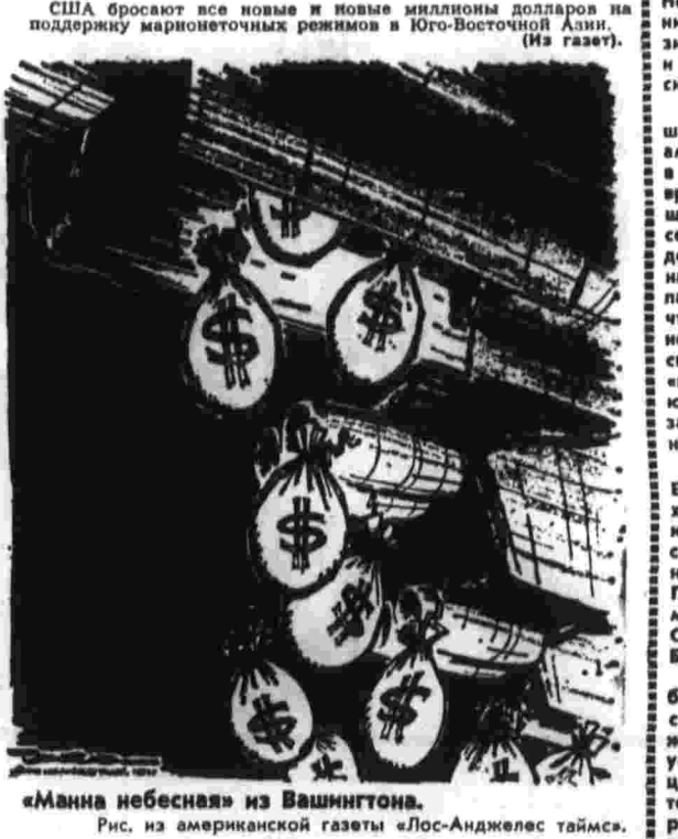
«МАННА НЕБЕСНАЯ» ИЗ ВАШИНГТОНА. Рис. из американской газеты «ЛОС-АНДЖЕЛЕС ТАЙМС».

РИС. ИЗ АМЕРИКАНСКОЙ ГАЗЕТЫ «ЛОС-АНДЖЕЛЕС ТАЙМС». США бросают все новые и новые миллионы долларов на поддержку марionеточных режимов в Юго-Восточной Азии. (Из газет.)