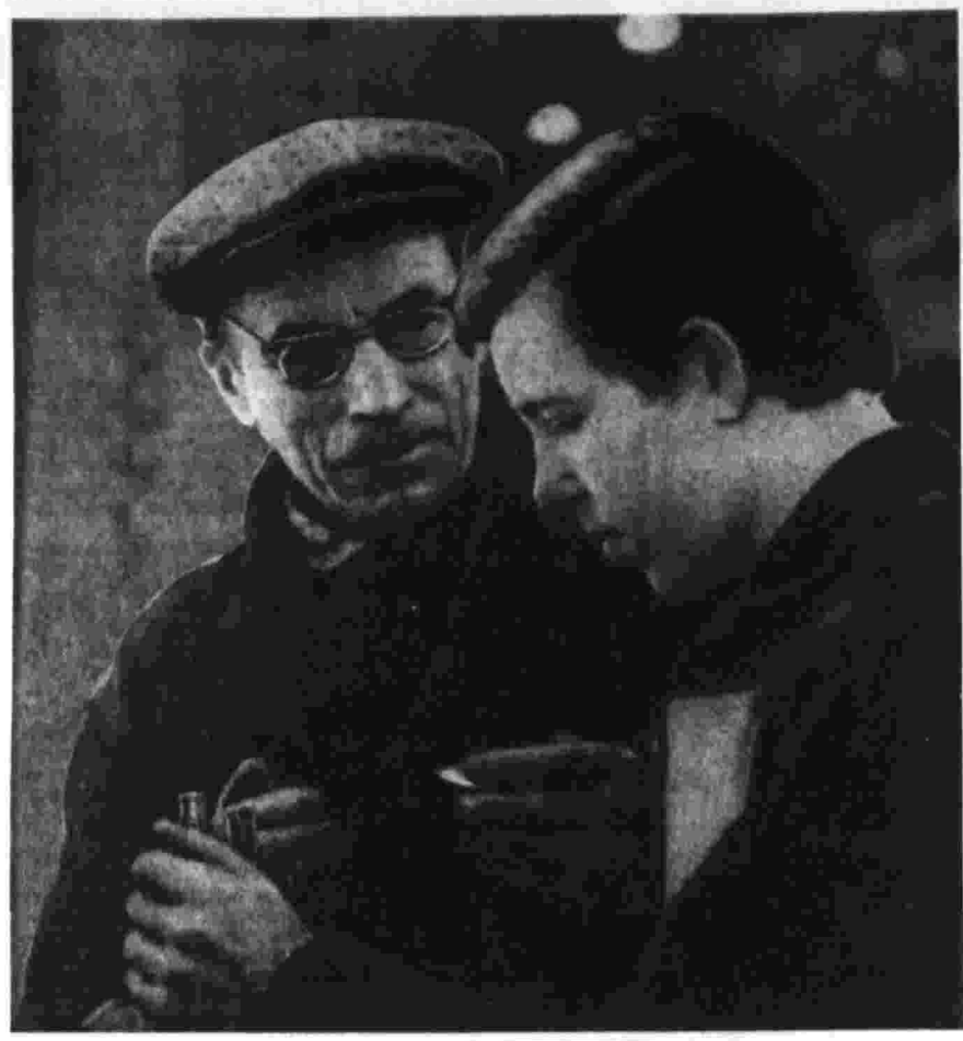
Рассказы о делегатах