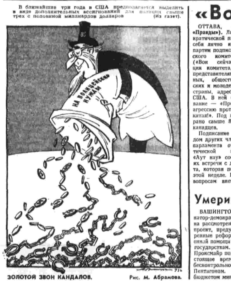
ЗОЛОТОЙ ЗВОН КАНДАЛОВ. Рис. М. Абрамова.

Заявление ЦК Патриотического фронта Лаоса В ближайшие три года в США предполагается выделить в виде дополнительных ассигнований для помощи свыше трех с половиной миллиардов долларов (из газет).