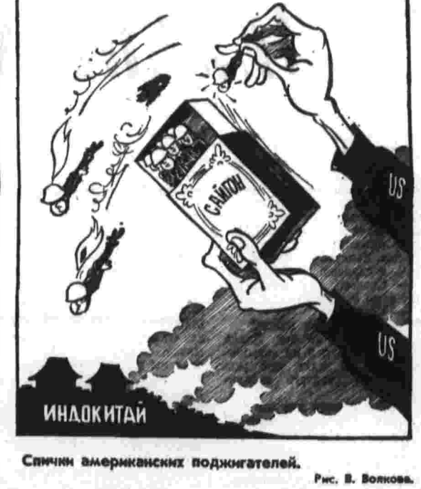
Смичин американских подкидателей.

Каждый день, как боевые сводки, печатаются в индонезийских газетах сообщения о тропических ливнях, распространяющихся на новые и новые районы. В сильной местности затоплены многие деревни, разрушены тысячи домов, уничтожены посевы. Страшным врагом для экономики страны, как было заявлено здесь на специальной пресс-конференции, являются последние наводнения, и в первую очередь зрелища почвы. Только на Яве, самом густонаселенном острове, где малоземелье стало проблемой номер один, 2,5 миллиона гектаров земли требуют восстановления плодородия почвы, 1,8 миллиона гектаров леса нуждаются в чрезвычайных мерах защиты. Земля и лес Индонезии оказались под угрозой. И виной тому не только стихийные бедствия, но и хищническое хозяйничанье владельцев иностранных концессий. Как сообщает газета «Сулу марха», четверть лесных богатств Индонезии — 20 миллионов гектаров — уже утрачены свою ценность с экономической точки зрения. Здесь похозяйничали японские и филиппинские компании. В прошлом году из Индонезии, главным образом с Калимангана и Суมาตรา, было вывезено пять миллионов кубических метров пород древесины, а в ближайшие четыре года намечено довести экспорт леса до 10 миллионов кубометров. Но пора ли возбудить о будущем индонезийские газеты. Когда над Калимантаном, Явой и Суมาตรา вступит клубиться засуха, когда будет принят закон-либо мера. М. ДОМОГАЩИХ.