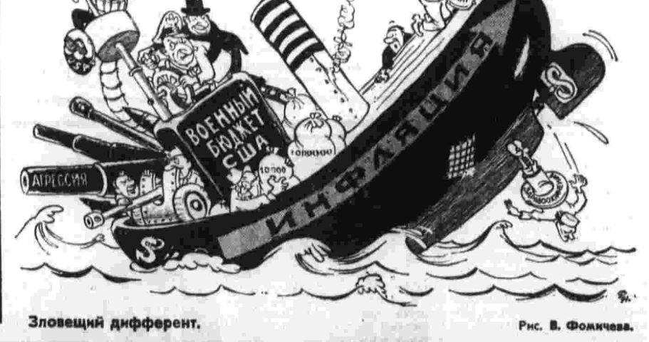
Зловещий дифферент. Рис. В. Фоменко.