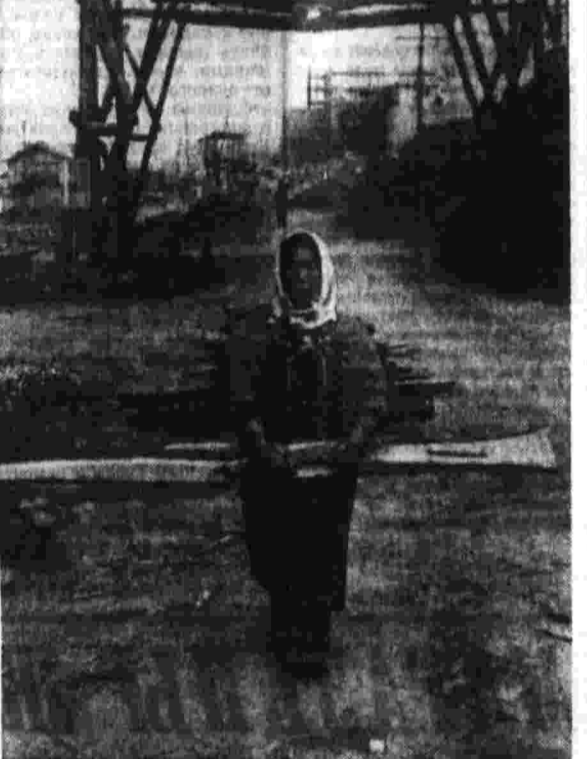
Фотоконкурс «Правда-71» Минору ТАКАТА. (Япония). И так каждый день.

ПЕКИН, 19. (ТАСС). Министры иностранных дел КНР, как и в предыдущие несколько лет, отказавшись от участия в заседании СССР в Китае в поездке в город Ухань, Харбин, Шаньинь, Люйшуй (Хорт-Артур) и Даль-