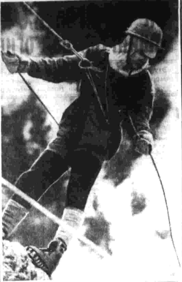
КОГДА МЫ ОТДЫХАЕМ

В Волгоград, 19. (Корр. «Правды» В. Попова). Сегодня в музее изобразительного искусства открылась выставка работ народного художника СССР Е. Вучетича.