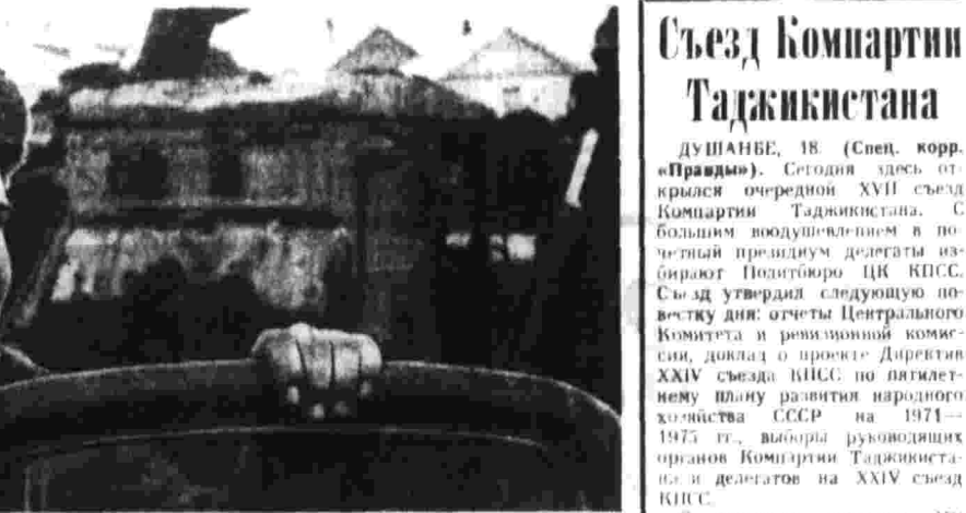
ЗАПИСАНО В ПРОЕКТЕ ДИРЕКТИВ