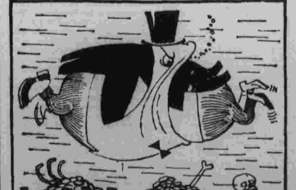
По законам большого бизнеса. Карикатура из газеты «Ланд оф Фольк».

4.987 БАНКРОТСТВ промышленных и строительных фирм было зафиксировано в 1970 году в Англии. Газета «Таймс» предсказывает, что в