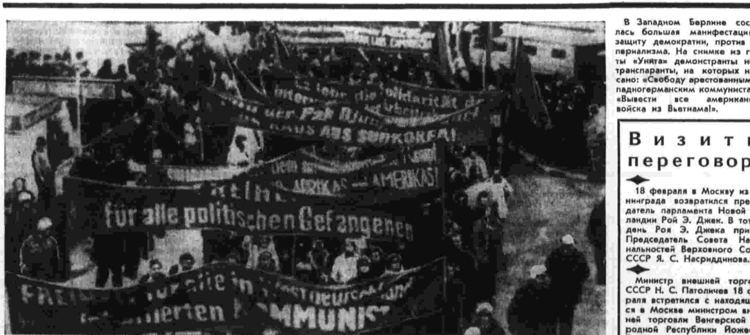
В Западном Берлине состоялась большая манифестация в защиту демократии, против империализма. На снимке из газет «Юнг» демонстранты несут транспаранты, на которых написано: «Свободу арестованным западногерманским коммунистам», «Вывести все американские войска из Вьетнама!»

В письме приводятся призывы начальнику лагеря, заранее оправдывающий любое нападение на заключенных.