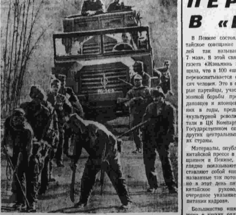
Десять лет назад английские патриоты — члены Народного движения за освобождение Анголы (ИПАА) атаковали тюрьму, радиостанцию и казармы португальских колонизаторов в Луанде, положили начало революционной борьбе за освобождение страны. На снимке — в поисках мин, заложенных патриотами, колонизаторы вынуждены прощупывать каждую глыбу земли.

развитию национальной киноиндустрии Бразилии наносит иностранные фильмы, нашедшие сексом и насилием. Они буквально наводнили экраны бразильских кинотеатров. По данным местной печати, в эту латиноамериканскую республику ввозится в два-три раза больше иностранных фильмов, прежде всего американских, чем в Италию, Францию, Испанию, несмотря на то, что в Бразилии в три-четыре раза меньше кинотеатров, чем в указанных странах. (ТАСС, 17).