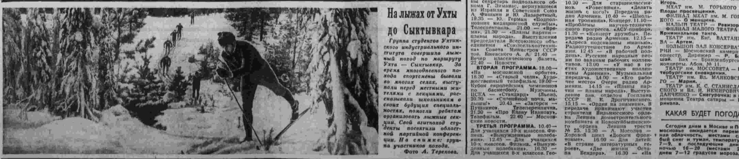
На лыжах от Ухты до Сыктывкара. Группа студентов Ухтинского индустриального института совершила лыжный поход по маршруту Ухта — Сыктывкар. За время лыжного похода по многим склонам, выступали перед местными жителями с лекциями, рассказывали школьникам о своих будущих специальностях, помогали ребятам организовать лыжные секции. Свои лыжные студенты посетили областную партийную конференцию. На снимке: группа участников похода.