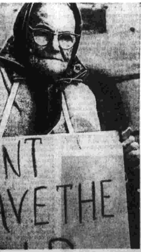
Фото из американской газеты «Пилл уорлд». (Фотохроника ТАСС).

Так правящая элита США «благородно» тружеников, которые десятилетиями создавали богатства и ценности для капиталистической Америки.