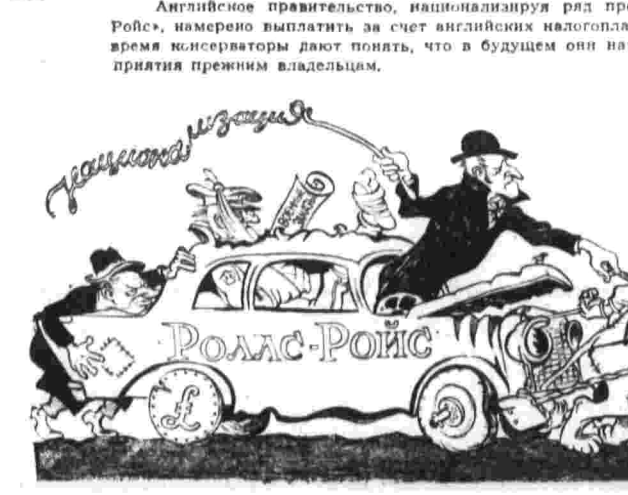
Вывозят... Рис. В. Фоминцев.

— Молодежь получила много, — говорит Иозеф, — за