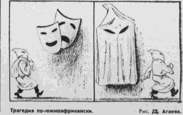
Трагедия по-южноафрикански. Рис. Д. Агаева.

● В АРГЕНТИНСКОЙ ПРОВИНЦИИ Кордова на заводах «Рено» и «Фиат» бастует несколько тысяч человек. ТАСС — Фрэнсис Пресс.