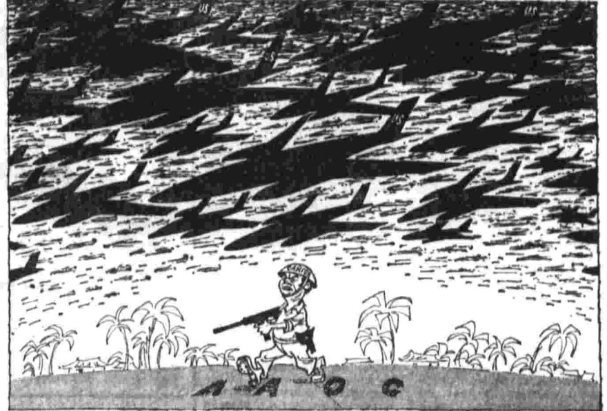
АГРЕССИЯ САЙГОНА И «НЕВМЕШАТЕЛЬСТВО» ВАШИНГТОНА.

Официальный Вашингтон заявляет, что Соединенные Штаты якобы «прямо не участвуют» в агрессии против Лаоса, а лишь поддерживают с воздуха сайгонские войска.