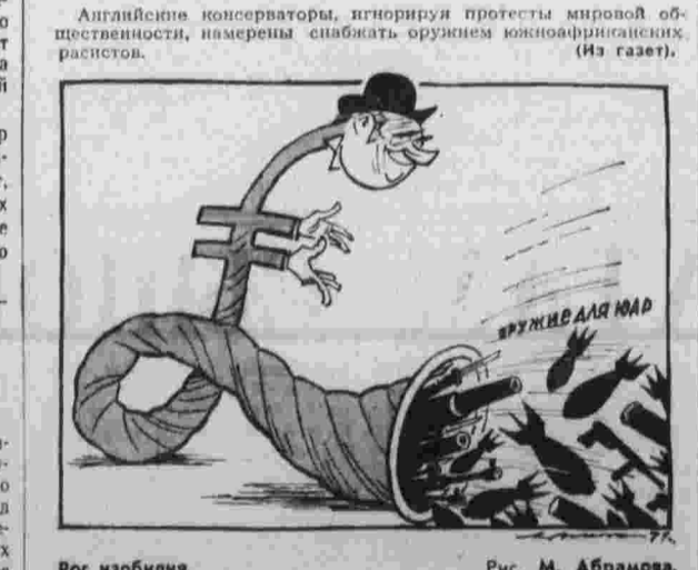
Рис. М. Абрамова.

В знак солидарности с ними забастовку объявили работники бензозаправки.