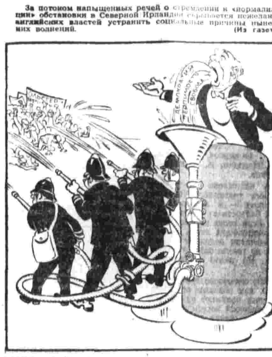
НЕИСКАЕМЫЙ ФОНТАН. Рис. В. Фомичева.

Отклоняют мирную инициативу НЬЮ-ЙОРК, 7. (ТАСС). Премьер-министр Израиля Голда Мейр отклонила новую мирную инициативу ОАР, предусматривающую частичный отвод израильских войск с восточного берега Суэцкого канала с целью его открытия для нормального международного судоходства.