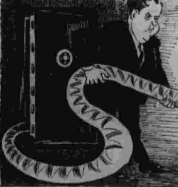
Ненасытный змей из налогового управления.

Непримиримостью в капиталистических странах рост налогов ухудшает и без того тяжелое положение трудящихся.