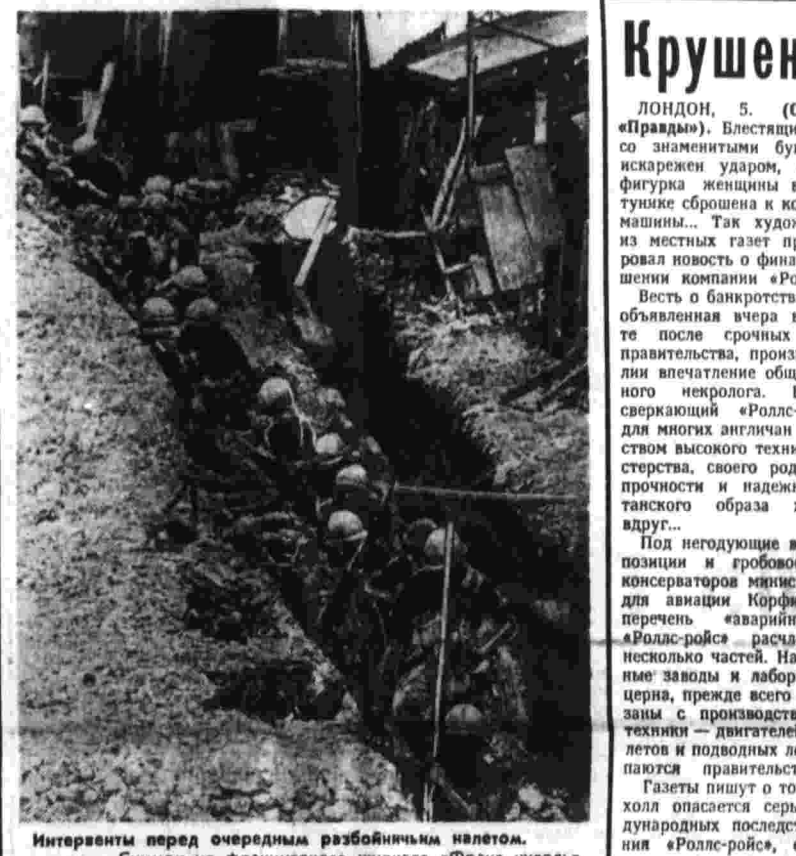
Интервенция перед очередным разбойничьим налетом. Снимок из французского журнала «Франс нувель».

ВАШИНГТОН, 5. (ТАСС). Группа американских конгрессменов объявила о внесении законопроекта, предусматривающего немедленное прекращение американской агрессии в Юго-Восточной Азии и полный вывод всех американских войск к 30 июня 1971 года. Выступивший от их имени член палаты представителей Уильям Райан сообщил о начале «широкой кампании в конгрессе против военной политики администрации». ПАРИЖ, 5. (ТАСС). Интервенция сайгонских войск в Лаосе и Камбодже при поддержке и руководстве американских вооруженных сил представлял собой дальнейшее расширение войны в Индокитае, говорится в заявлении Политбюро Французской компартии. ФКП призывает французское правительство осудить эту войну и проводить активную политику, чтобы заставить США уважать Женевские соглашения по Лаосу.