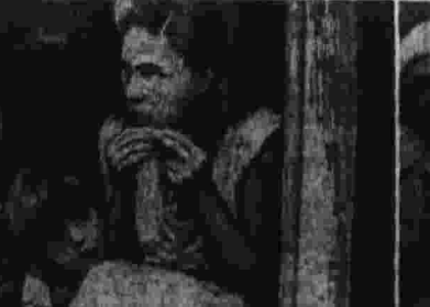
Шахтеры добиваются отмены решения администрации закрыть шахты.