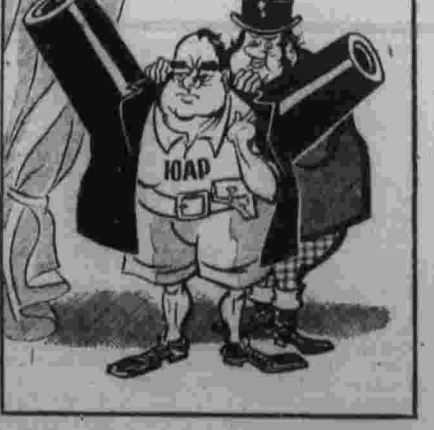
Покорный британский клиент южноафриканский. Рис. В. Волкова.