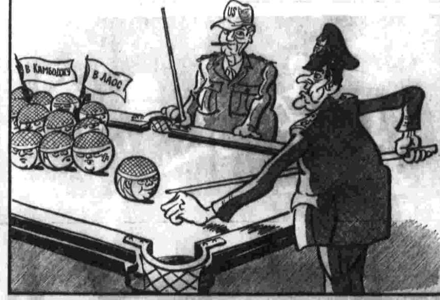
Сайгонские бомбардировщики опасной американской игры.