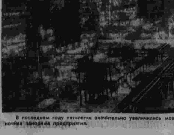
В последнем году пятилетки значительно увеличилась мощность Полочского нефтеперерабатывающего завода. На снимке: ночная панорама предприятия.