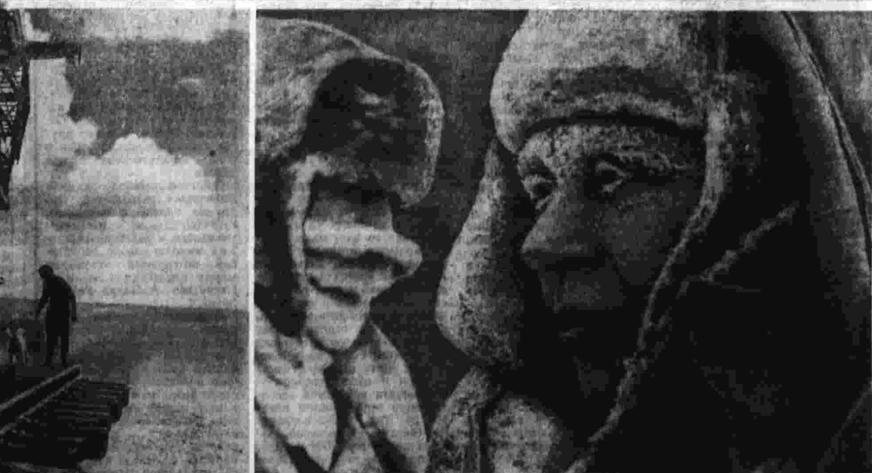
ФОТОКОНКУРС «ПРАВДА-71» В. ШИН (Москва). Шаги в будущее. П. БУНИГИН (Норильск). Покорители Таймыра.