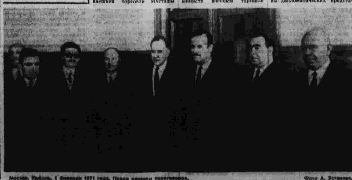
Москва, Кремль. 1 февраля 1971 года. Перед началом переговоров.