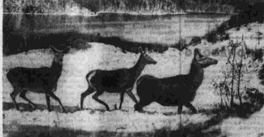
ГЕК-ГЕЛЬСКИЙ заповедник — жемчужина Азербайджана. Здесь, на высоте 1.600 метров, ученые работают над повышением биологической продуктивности лесов и лугов, восстановлением фауны Малого Кавказа и другими проблемами. На снимке: благородные кавказские олени в заповеднике.

Солнечным светом, радостью пронизаны картины, что заполнили залы музея. Нас встречают весенние букеты цветов в садах Прованса, зеленые просторы лугов, оживленный поток людей на бульварах... Вот картина К. Моне «Вокзал в Сен-Лазаре» — влочка пара под стеклянной крышей, локомотив... Это один