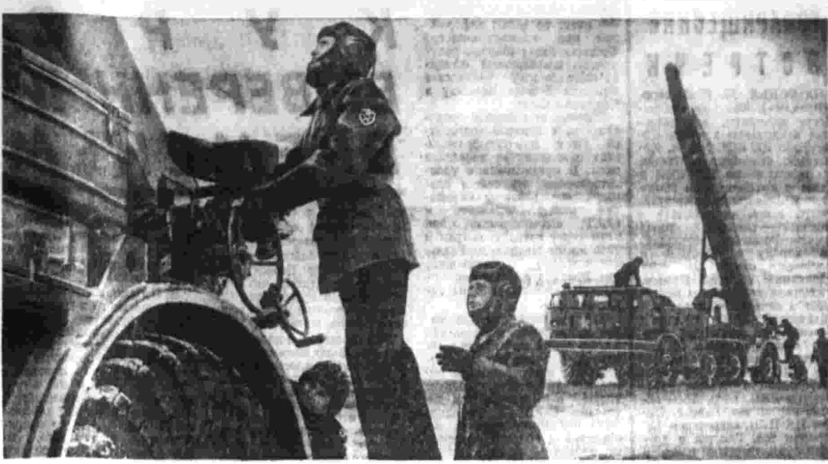
Работники в своей части на учениях.

Е. ФЕДОРОВ, Академик, начальник Главного управления гидрометеослужбы СССР.