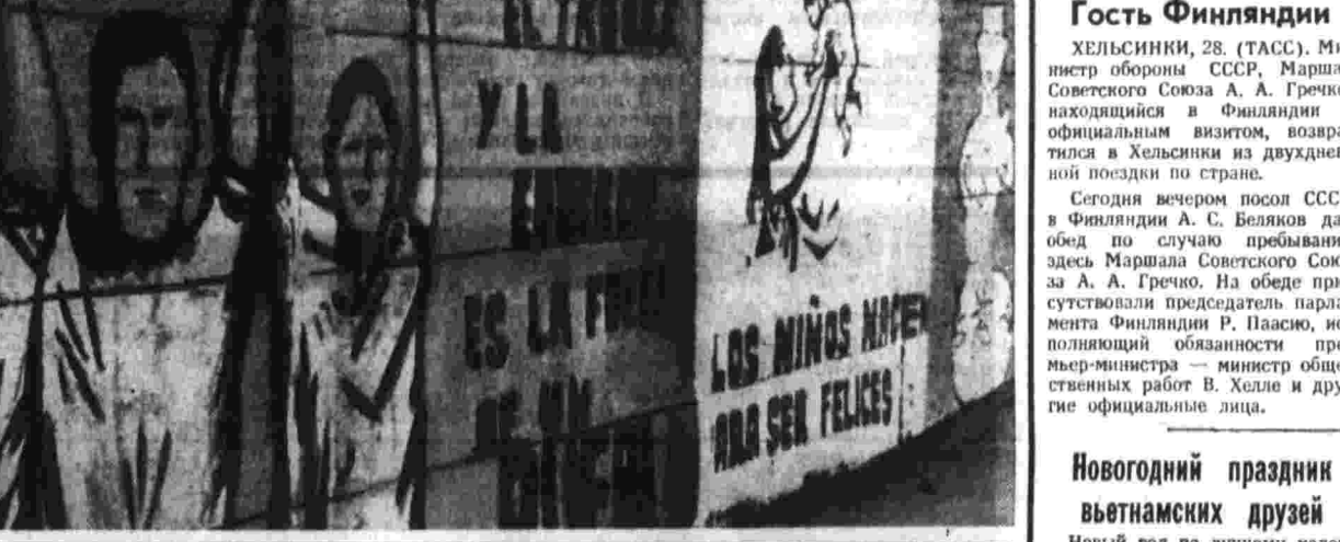
Стены домов и ограды в чилийской столице покрыты рисунками, плакатами. Вы видите надписи, которые гласят: «Работа и учеба — сила народа». «Да, приходится, чтобы быть счастливыми». В этих и других лозунгах находят отражение подлинно нового чилийского правительства.

ТОКИО. Эпохальный эксперимент «Венеры-7» — так называют здесь последние достижения советской космонавтики. Оно находится в центре внимания научной общественности и печати Японии. «Можно сказать», — заключает профессор университета