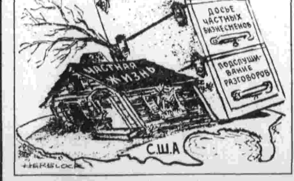
Хрупкий домик в тени... Карикатура из американской газеты «Интернэшнл геральд трибюн».

Эта «программная» речь показала упорное нежелание лидеров ХДС — ХСС считаться с реальной европейской действительностью и хоть в какой-либо мере ориентироваться на ясно выраженное стремление преобладающей части населения ФРГ к установлению добрых отношений, взаимовыгодного сотрудничества с Советским Союзом и другими социалистическими странами. Столь же несостоятельными оказались попытки скрыть внутренний кризис и обмануться разногласия в ХДС. Окончательный съезд задержался на несколько часов, но представители христианско-демократической молодежной организации «Юнге унион» активно выступили за исключение из программы положения о признании границ по Одеру — Нейсе. В своем выступлении молодые делегаты пытались доказать, что без этого никто уже не поверит словесным заверениям ХДС о стремлении к миру и взаимопониманию с Советским Союзом. Призывы к разуму и реальности не пробудили слепую, глухую стену реакционного большинства. Однако стало ясно, как заявил один делегат, что внутри ХДС существует не толь-