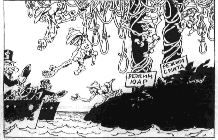
В РАСИСТСКОМ ЗАПОВЕДНИКЕ. Рис. А. Баженова.

В административном центре провинции Британская Колумбия городе Виктории перед зданием провинциальной законодательной ассамблеи состоялась массовая демонстрация безработных — участников «марша на Викторию». Демонстрация прошла под лозунгом: «Работы, а не пособий до безработицы». Отличительной особенностью «марша» было то, что он был организован Федерацией труда Британской Колумбии. Это говорит о том, что профсоюзная структура начинает осознавать свою ответственность перед трудящимися за решение одной из самых острых социальных проблем сегодняшней Канады — проблемы массовой безработицы. Газета «Канадиан трибун» пишет в этой связи в редакционной статье, что Федерация труда Британской Колумбии показала всему профсоюзному движению, как нужно организовывать безработных, как бороться за их права, как действовать. К. ГЕЙВАНДОВ.