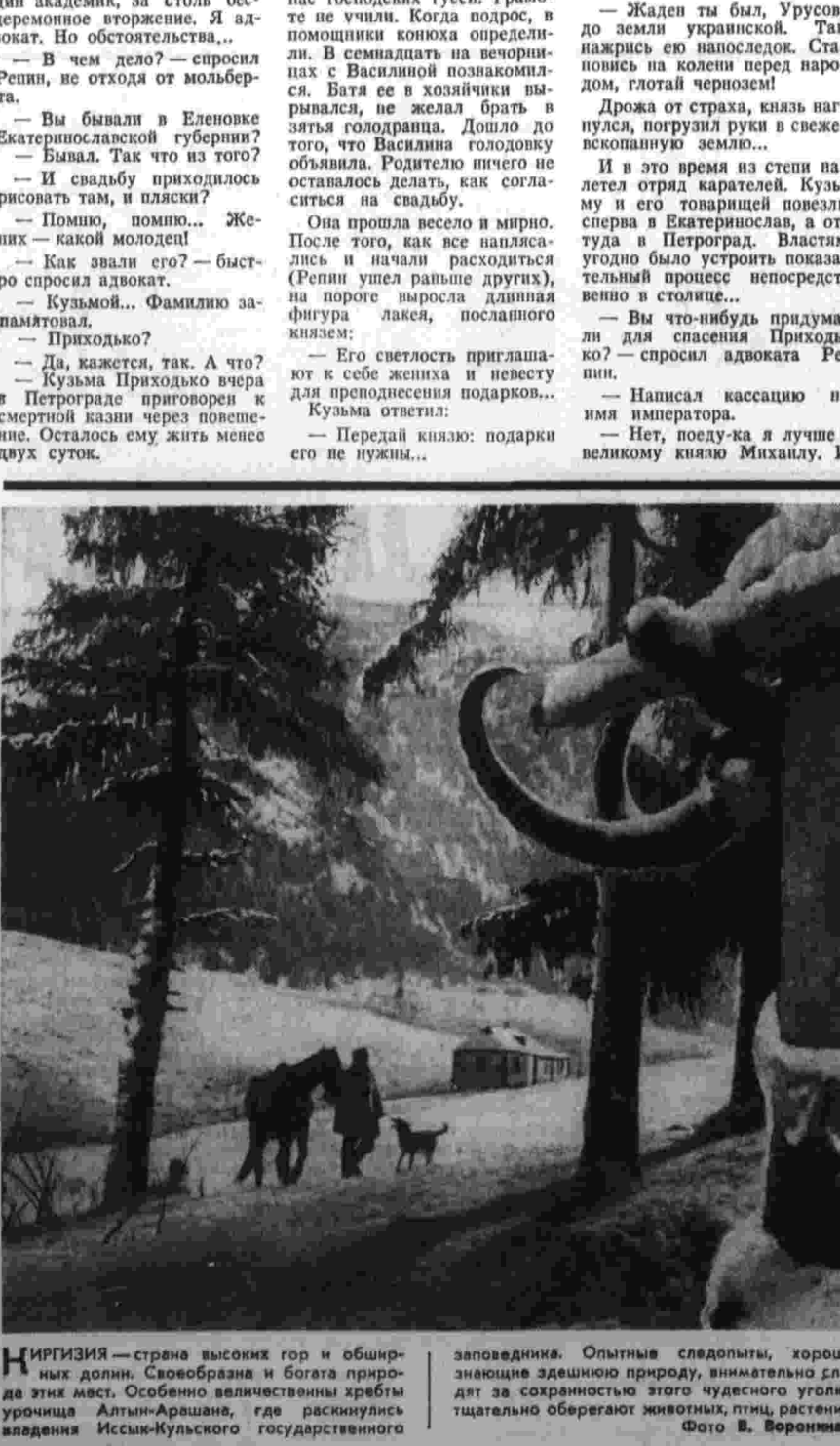
Фот. В. Воронина.

Ф. ЮНИОН. Случайный результат сезона на чемпионате мира в спринтерском многоборье В. Муратов. Второй