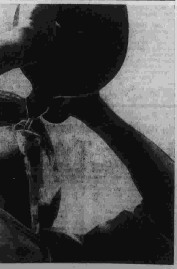
Эрике МОРЕНО (Куба). На сафре.