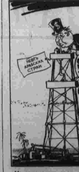
Имperialistические трутни. Рис. В. Волкова.