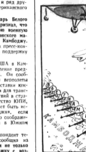
Воздушная поддержка. Рис. М. Кузнецова.

ХАНОЙ, 19. (ТАСС). По сообщению из Южного Вьетнама, 16 и 17 января Народные вооруженные силы освобождения нанесли удары по многочисленным укрепленным пунктам и позициям американско-сайгонских войск. В провинции Лондонг патриоты нанесли удар по позиции 53-го полка марионеточных войск в 150 километрах к северо-востоку от Сайгона. В провинции Лонгхьянь Народные вооруженные силы освобождения атаковали позиции 1-й аэромобильной дивизии США в 100 километрах к северо-востоку от Сайгона. В эти же дни Народные вооруженные силы освобождения в провинциях Тхатхиен и Тхуодок сбросили три американских вертолета.