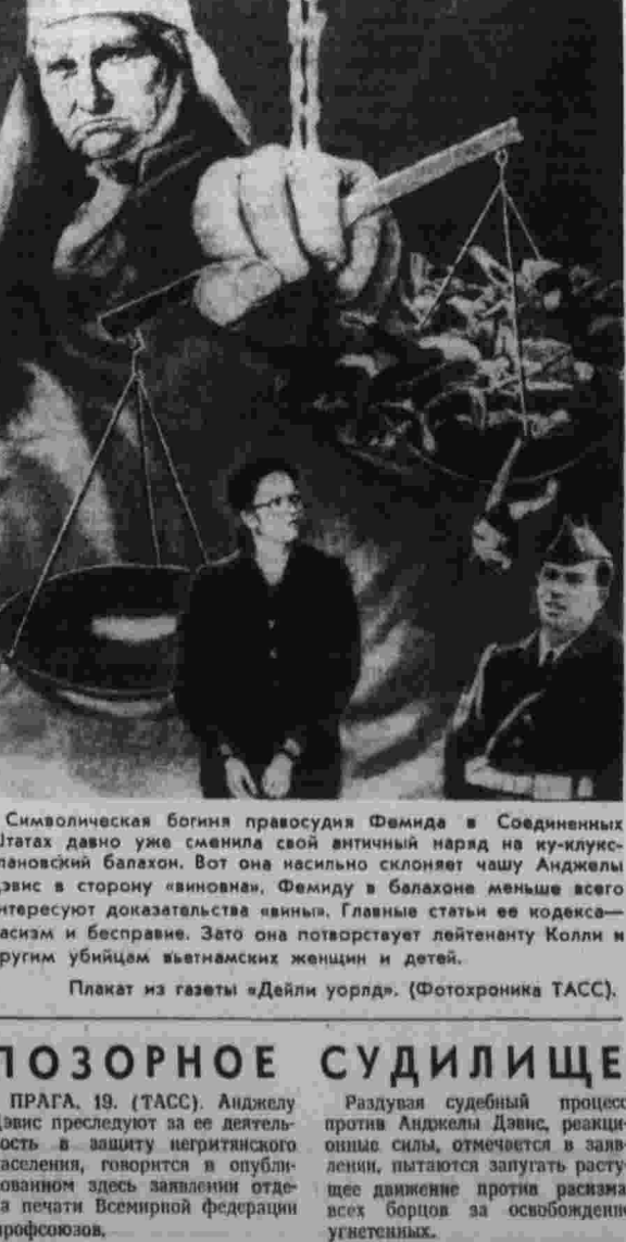
Символическая богиня правосудия Фемиде в Соединенных Штатах давно уже сменила свой античный наряд на ил-хулиганский балахон. Вот она насильно склоняет чашу Анджелы Дэвис в сторону «виновных», Фемиде в балахоне меньше всего интересуют доказательства вины. Главные статьи ее кодекса — расизм и бесправие. Зато она потворствует лейтенанту Колли и другим убийцам вьетнамских женщин и детей. Плакат из газеты «Дейли уорлд».