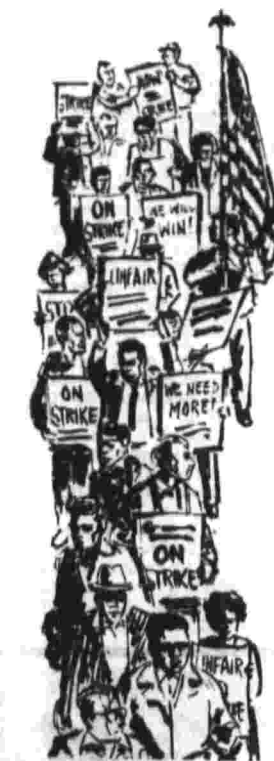
Забастовщики. Рисунок из газеты «Дейли уорлд».

Волна забастовок в Питтсбурге — Антипрофсоюзный законопроект Белого дома предоставляет полномочия президенту запрещать забастовки на срок более 90 дней Прогнозы журнала «Ю. С. ньюс энд Уорлд рипорт»