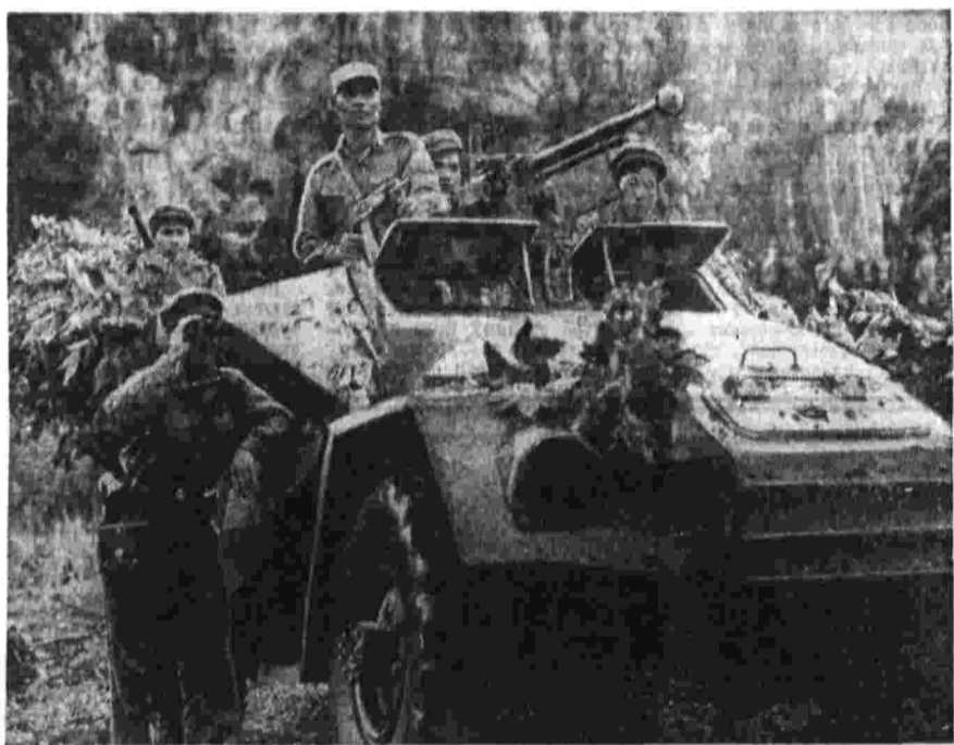
Отряды Патриотических вооруженных сил Лоса, действующие в провинции Аттопе, за последние три месяца вывели из строя около 800 солдат противника и захватили большое количество вооружения. На снимке: лосские патриоты в боевом дозоре.

Камера 6 метров в длину, 5 в ширину. В ней — 15 акционных мешков. Каменный мешок. Часть стены, выходящей в коридор, — из двойного ряда толстых решеток. В противоположной стене — окованный железом проем — окованный железом проем — окованный железом проем.