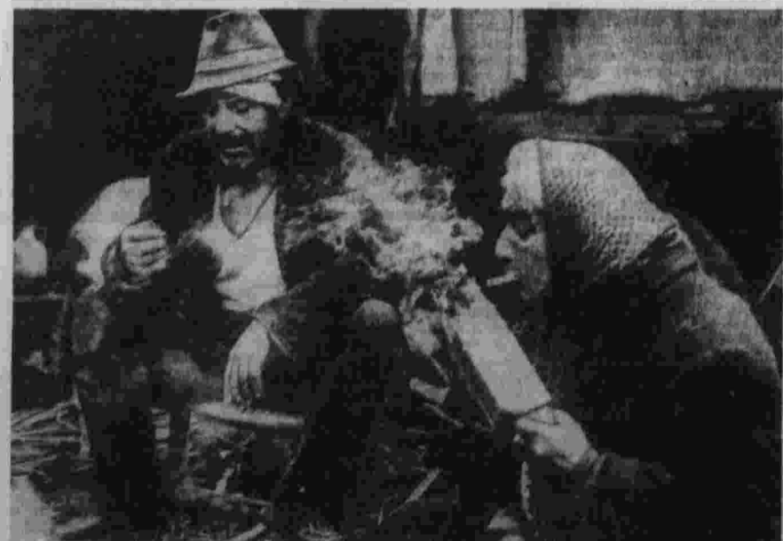
КОНКУРС «ПРАВДА» П. КЭРОЛЬ (Испания). «Нищета».

В номере напечатаны заметки о социологическом конгрессе в Варне, рецензия Э. Араб-оглы «Словес мутные очки».