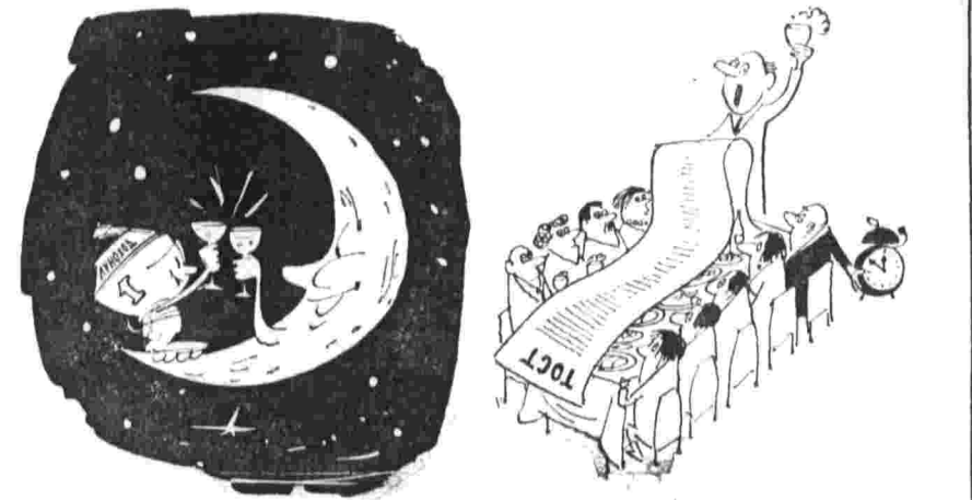
С Новым несмешным годом! Не прозевать бы Новый год...