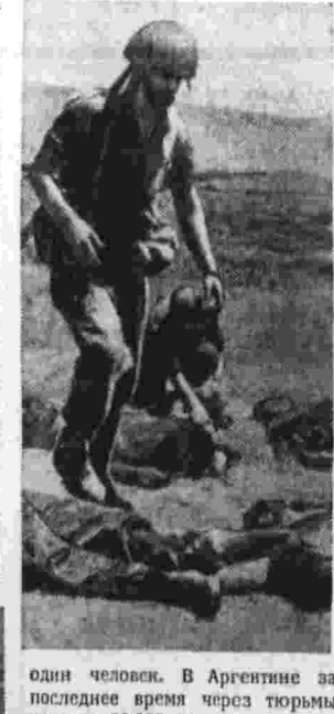
один человек. В Аргентине за последние время через тюрьмы прошли 20.000 человек. Жизненные интересы человечества все более очевидно расходятся со сверхкорыстными интересами империалистических хищников. Новые и новые миллионы людей всех стран и континентов раздают призывы Советского компартии 1969 года. «Чтобы положить конец преступным действиям империализма, который может навредить на человечество еще более тяжкие бедствия, рабочий класс, демократические, революционные силы, народы должны объединиться и выступать сообща». Виталий КОРИОНОВ.

БОНИ, 31. (ТАСС). Вчера вечером неизвестные лица подожгли варшавское устройство, под здание гамбургской редакции газеты «Унзере цайт» — органа Германской коммунистической партии. В результате взрыва помещенные редакции нанесены значительный ущерб. Человеческих жертв нет. Правление Гамбургской организации Германской коммунистической партии и гамбургская редакция газеты «Унзере цайт» выступили с совместным заявлением, в котором указывают, что провокационная вылазка организована неонацистскими кругами, членами так называемой «акции сопротивления». Вы-