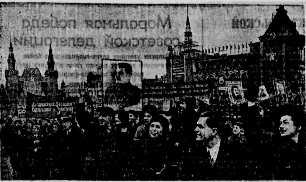
Москва, 7 ноября 1948 года. Демонстрация на Красной площади.