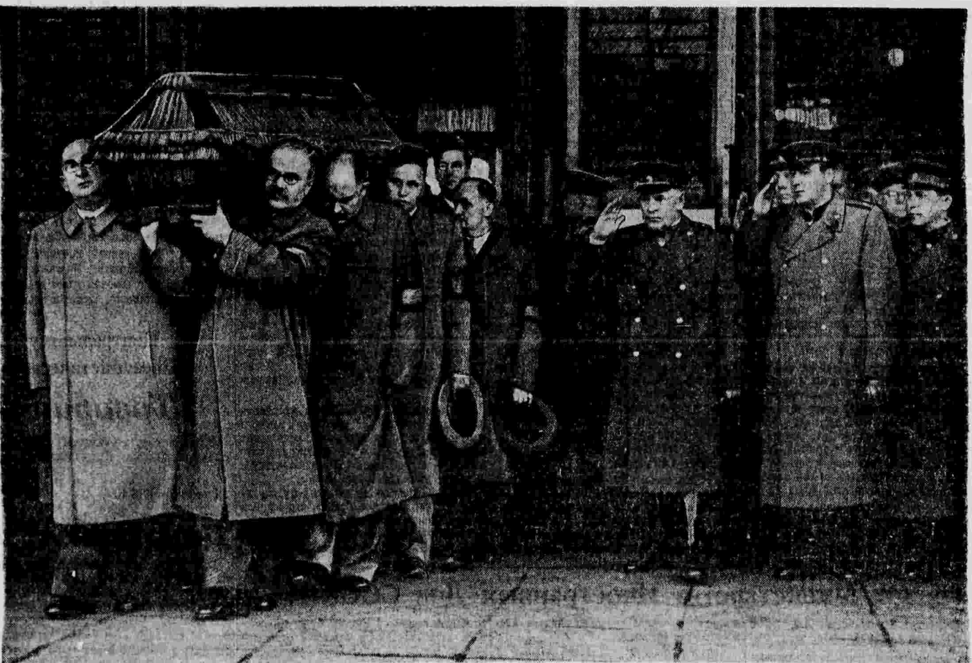
Москва, Белорусский вокзал 1 сентября 1948 г. Товарищи Л. П. Берия, В. М. Молотов, Л. М. Каганович, Н. А. Вознесенский, М. Ф. Шкрятов и М. А. Суслев выносят гроб с телом А. А. Жданова.