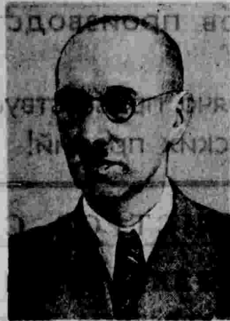
М. И. Гуревич.