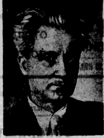
Б. Д. Греков.