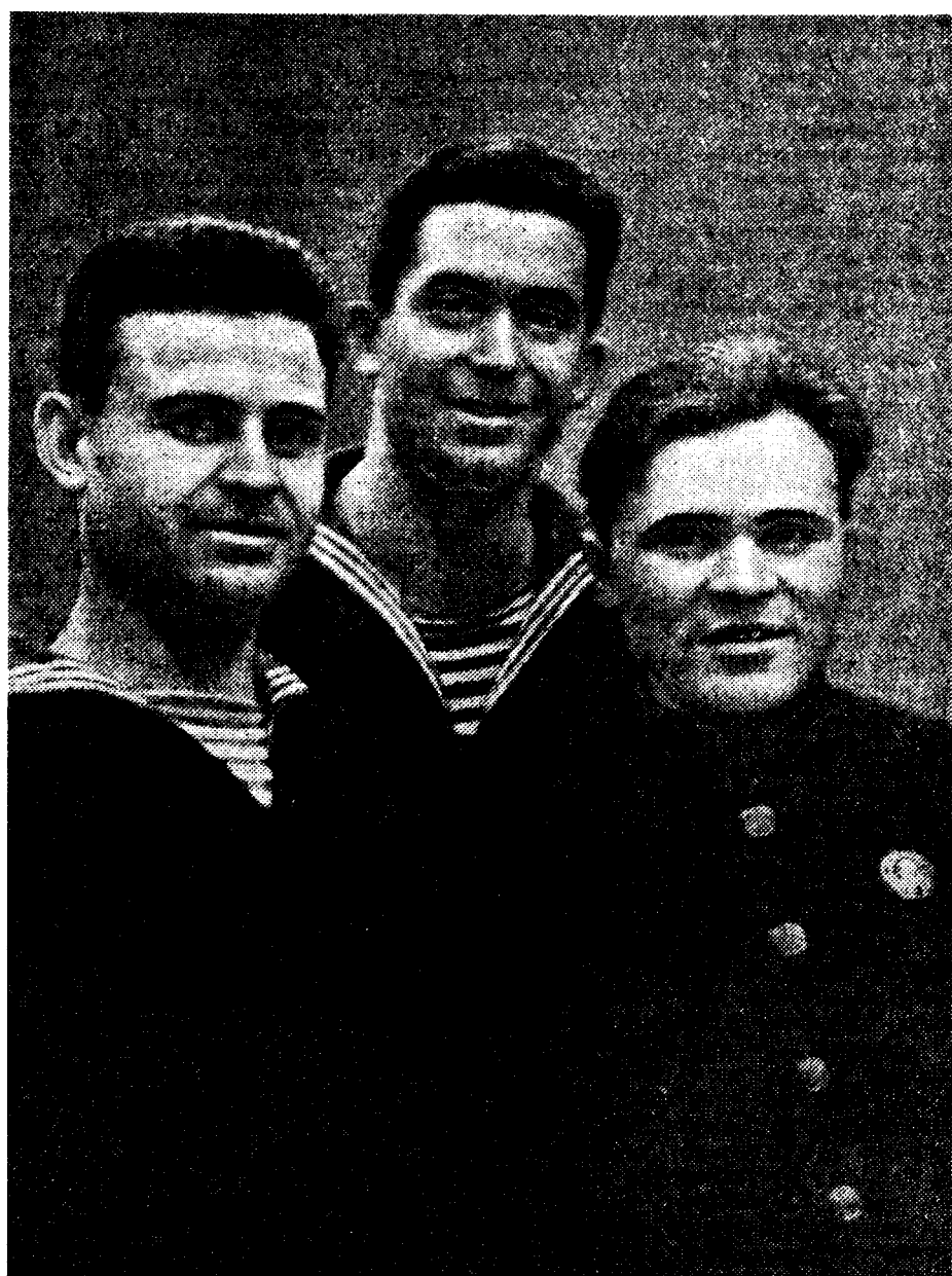
Исполнилось 15 лет со дня организации Экспедиции подводных работ особого назначения (ЭПРОН). На снимке — отличник-водолаз ЭПРОН...