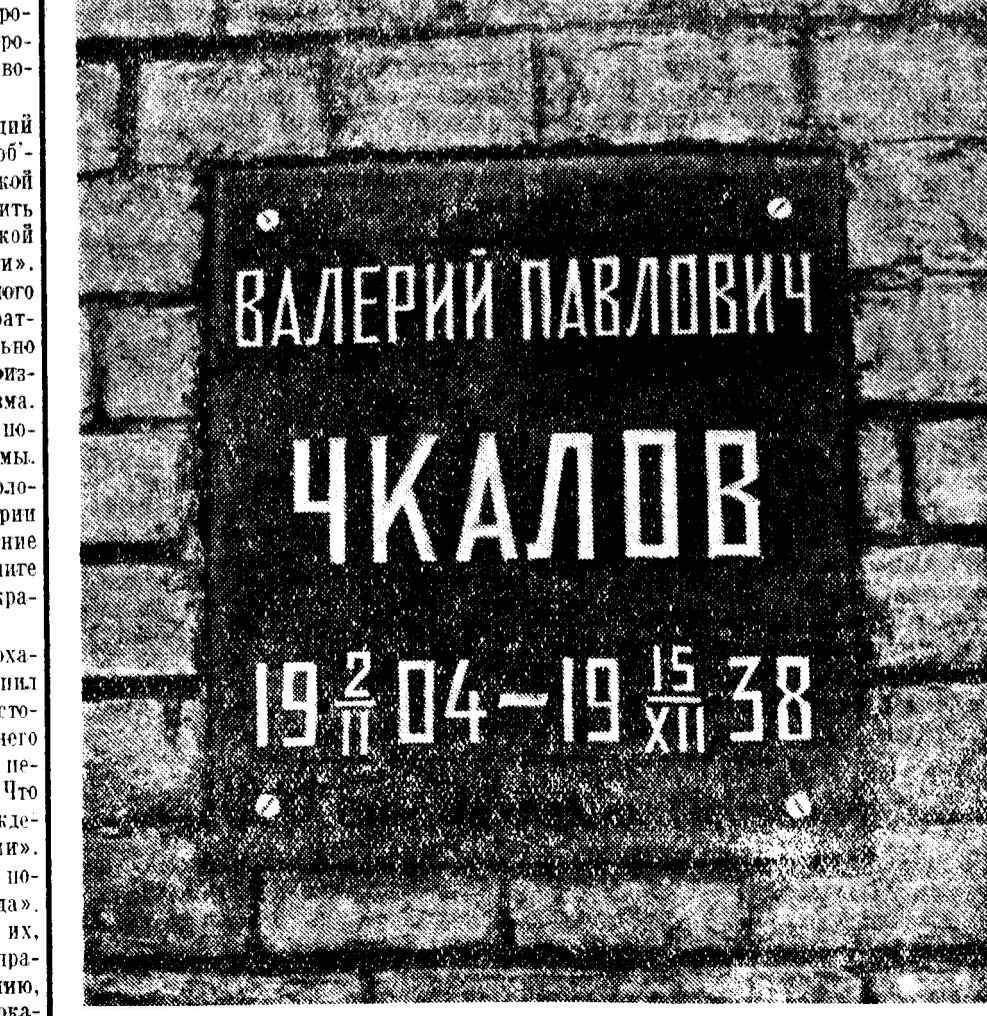
Доска на Кремлевской стене, где замурована урна с прахом В. П. Чкалова.

В связи со смертью Героя Советского Союза комбрига Валерия Павловича Чкалова на имя Народного Комиссара Иностранных Дел тов. Литвинова поступили соболезнования от имени итальянского посла г-на Россо, литовского посланника г-на Батрушайтиса, финляндского посланника г-на Ирье-Кюнеса, венгерского посланника г-на Кингерт-Арноти, чехословацкого посланника г-на Фурцигера, шведского посланника г-на Вингера и бельгийского посланника г-на Хейндрикса. (ТАСС).