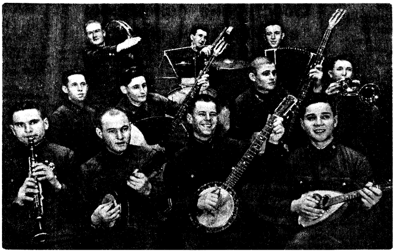
Джаз-оркестр части, которой командует тов. Верзин (Киевский особый военный округ).

КАРАСУБАЗАР (Крымская АССР), 19 декабря. (Корр. «Правды»). Заключено строительство Тайганского водохранилища, начатое в 1934 году.