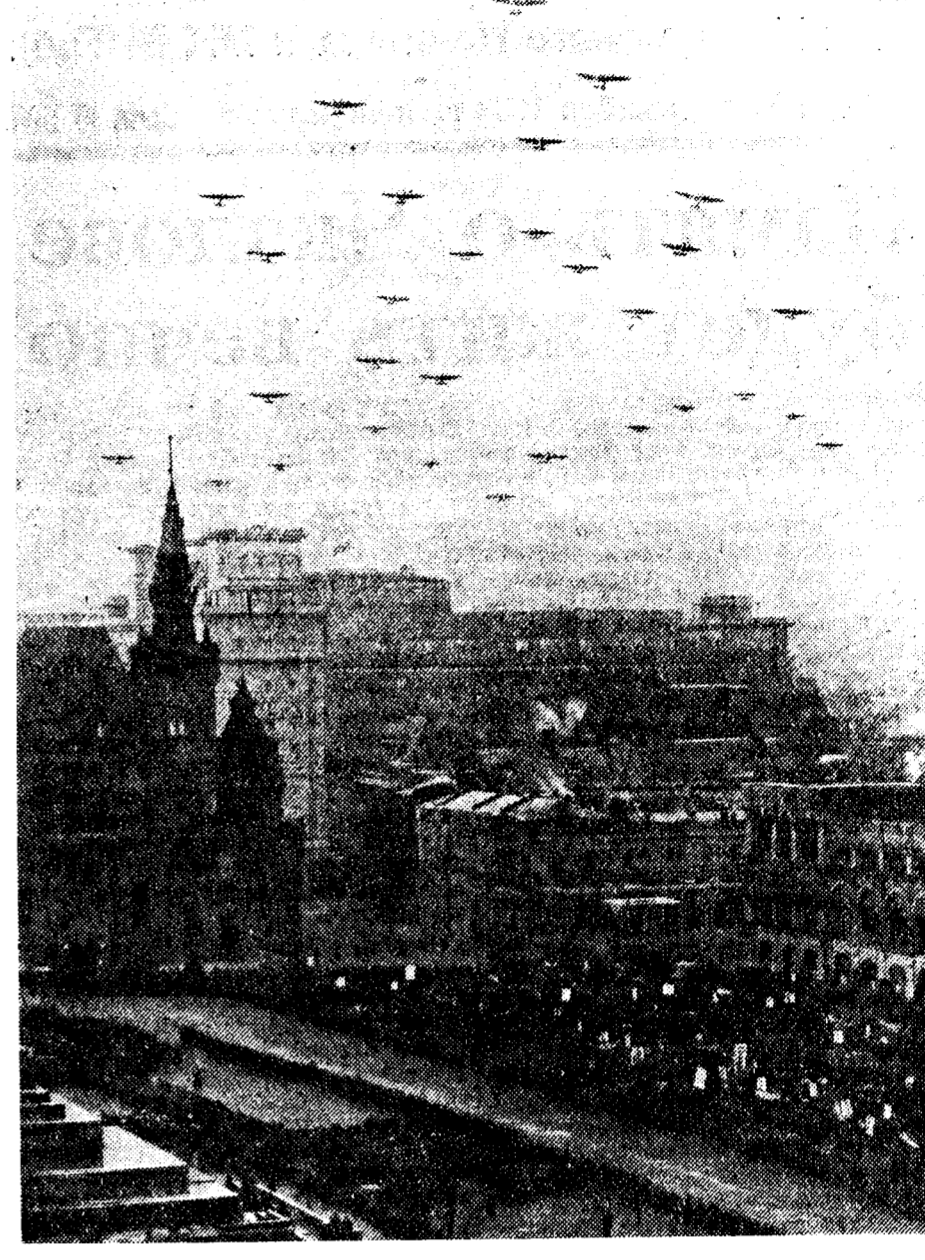
Похороны В. П. Чкалова. Самолеты над Красной площадью во время траурного митинга.