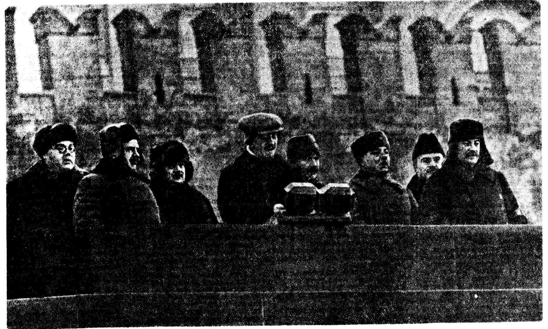
Похороны В. П. Чкалова. Товарищи Шербаков, Андреев, Жданов, Булганин, Л. М. Каганович, Ворошилов, Молотов и Сталин на трибуне мавзолея во время траурного митинга.