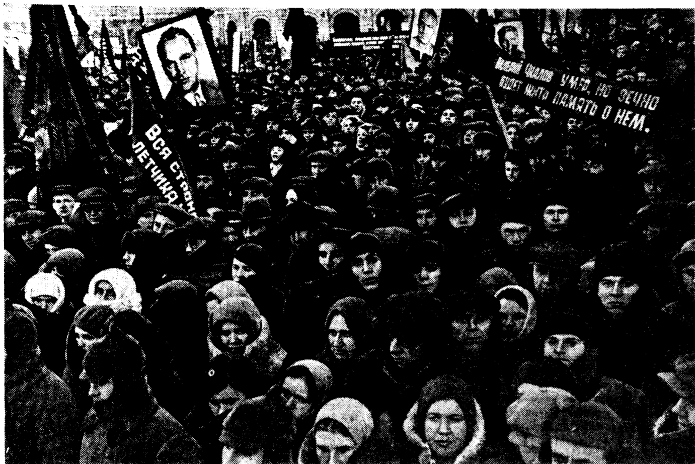
Похороны В. П. Чкалова. Трудящиеся Москвы на траурном митинге на Красной площади.