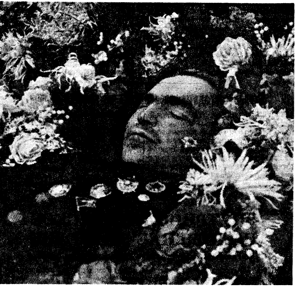
Валерий Павлович Чкалов в гробу.