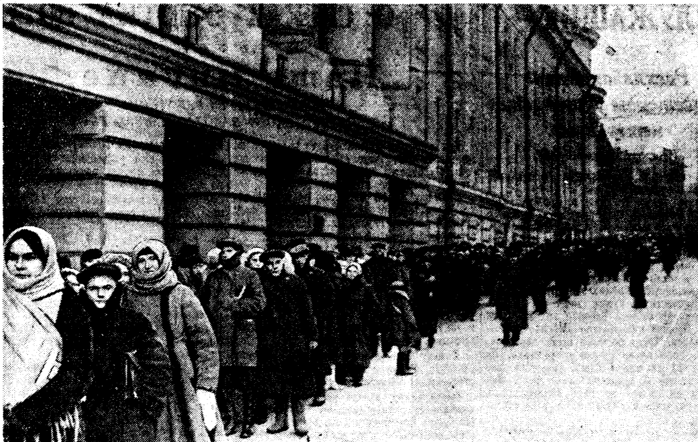
Трудающиеся Москвы направляются в Колонный зал Дома союзов для прощания с покойным товарищем В. П. Чкаловым.

Пусть выше влетают могучие крылья, — Победой героя полчим своего, В грядущих боях погонит аскадрилья Большое и славное имя его! Вас. ЛЕБЕДЕВ-КУМАЧ.