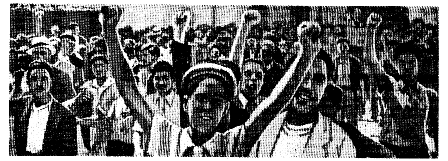
Демонстрация протеста молодежи гор. Туниса против территориальных притязаний итальянского фашизма.

* В Англию прибыла вторая группа детей беженцев-евреев из Германии численностью в 500 человек.