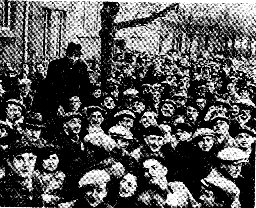
Рабочие Аржентей (предместье Парижа) у Народного дома, где происходил митинг протеста против локуата...